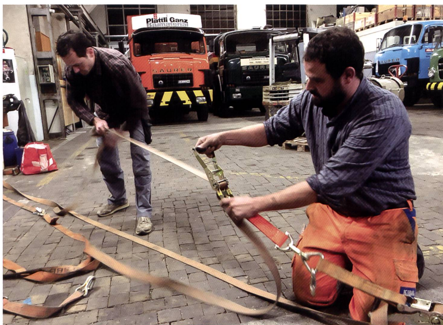
Unter winterlichen Bedingungen (bei 5°C!) wird eisern weitergearbeitet.