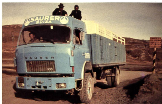
Ein Exportvorführfahrzeug in Bolivien