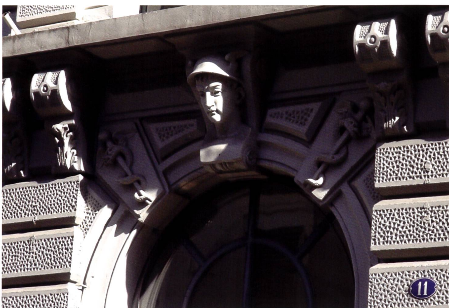
Merkur über dem Haupteingang