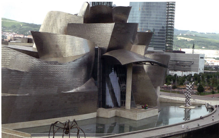
Das «Guggenheim Bilbao» – die geschwungene Fassade ist aus Titan.

Guggenheim Museen gibt oder gab es in SoHo New York, in Guadalajara, in Las Vegas, in Venedig und in Berlin. Eines ist jetzt im Bau in Abu Dhabi, entworfen wiederum von Frank Gehry. Somit hat Solomon Guggenheim über seine Foundation noch heute eine Ausstrahlung weltweit.