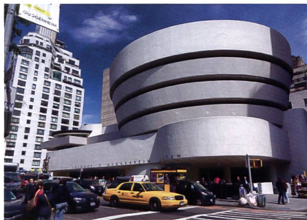
Guggenheim Museum NY

Das «Guggenheim» in New York gehört zu den weltbekanntesten Museen für moderne Kunst. Was aber für uns sehr interessant ist: Der Gründer Solomon Robert Guggenheim lebte und arbeitete als junger Mann in St.Gallen und in Plauen.