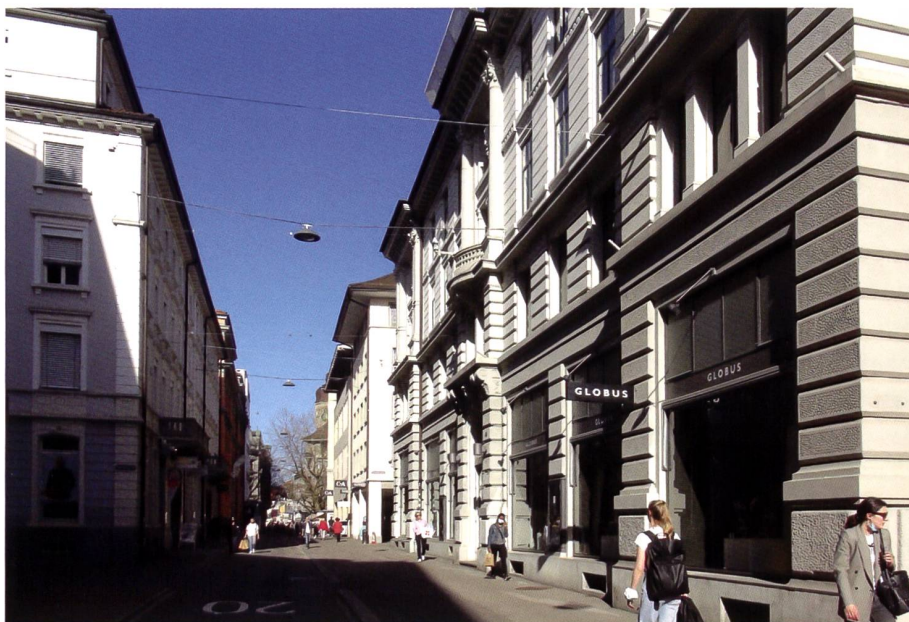
Rechts Vadianstrasse 11, der 1885 erstellte Firmensitz von Guggenheim Sons (heute Globus), Links Vadianstrasse 8, der vorherige Firmensitz.

1926 begann er, Werke von modernen Künstlern zu sammeln. Das erste abstrakte Gemälde, welches Solomon Guggenheim für seine Sammlung erwarb, war von Wassily Kandinsky, die «Komposition VIII 1923». Ein weiteres von insgesamt 150 Werken des russischen Künstlers Kandinsky im Guggenheim Museum NY