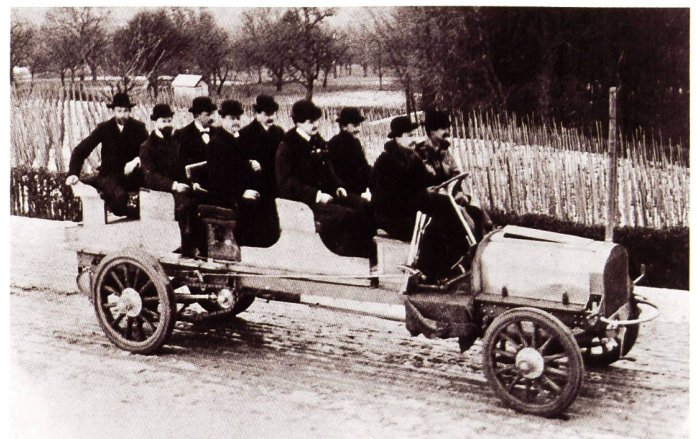
Der erste Saurer OLW 3TK Chassisnr. 2615/1 mit AM II-Motor Nr. 1452 für Motor Car Emporium (MCE) in London (GB) auf Probefahrt. Dieses Omnibus-Chassis wurde auch als «Char à banc» bezeichnet und war der Urahne aller späteren Saurer-Omnibusse!, Nr. 623 (Aufnahme Januar 1905)