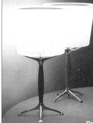
Orione Tavolo Rodolfo Dordoni, 1992