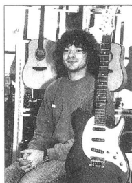
Michael Locher Gitarren und Equipment