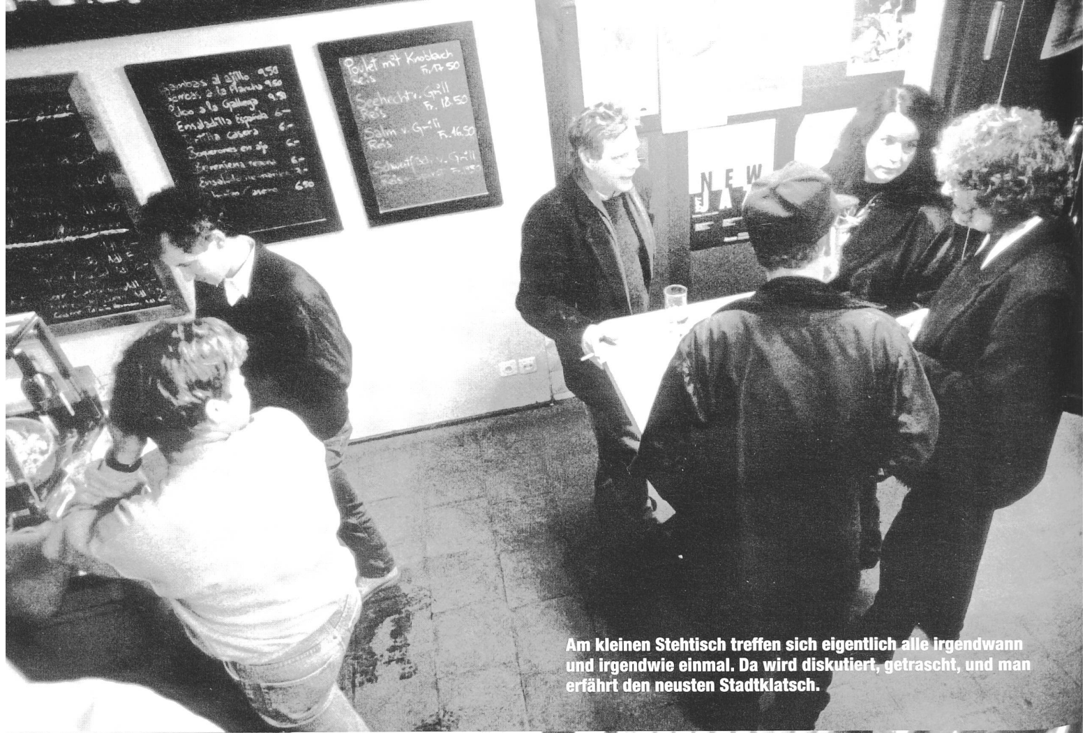
Am kleinen Stehtisch treffen sich eigentlich alle irgendwann und irgendwie einmal. Da wird diskutiert, getratscht, und man erfährt den neusten Stadtklatsch.