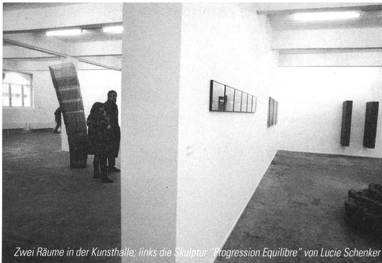
Zwei Räume in der Kunsthalle; links die Skulptur "Progression Equilibre" von Lucie Schenker

Es bleibt zu hoffen, dass die Verantwortlichen jetzt die Konsequenzen daraus ziehen und ein Konzept für eine regelmässige juriierte Ausstellung schaffen. Ein institutionalisiertes, in einem bestimmten Turnus abgehaltenes Forum für Kunstschaffende mit regionalem Bezug wäre nur wünschenswert. Es würde Anreize bieten und könnte die Grundlage zu einem regelmässigen Austausch über die Region hinaus schaffen. In diesem Sinne sollte auch die von Konrad Bitterli geäusserte Idee einer Datenbank unbedingt verfolgt werden.