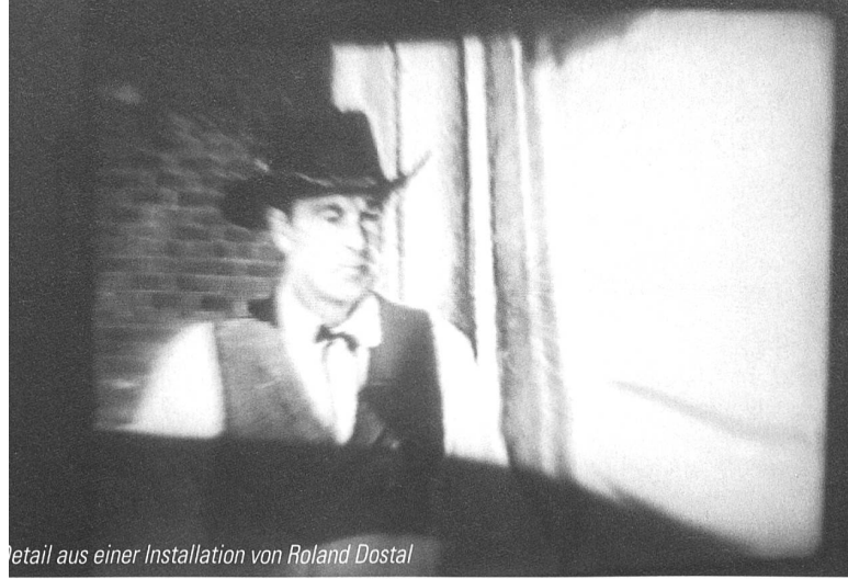
Detail aus einer Installation von Roland Dostal

Leserbrief im "St.Galler Tagblatt" vom 13. Dezember 1997