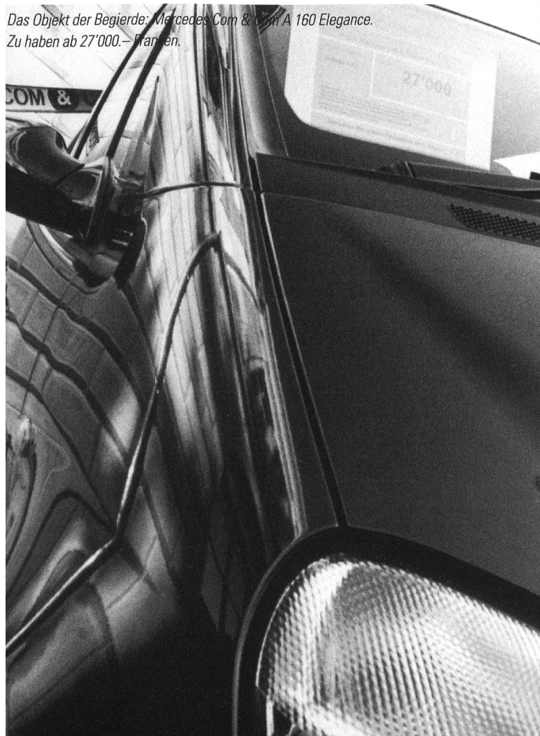
Das Objekt der Begierde: Mercedes Com & Com A 160 Elegance. Zu haben ab 27'000.- Franken.