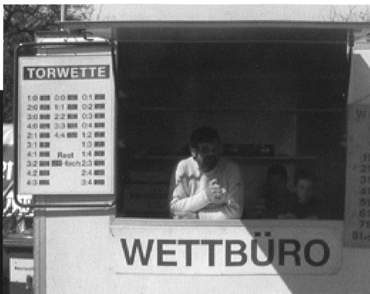
Wetten, dass Austria Lustenau am Ende doch nicht absteigt.