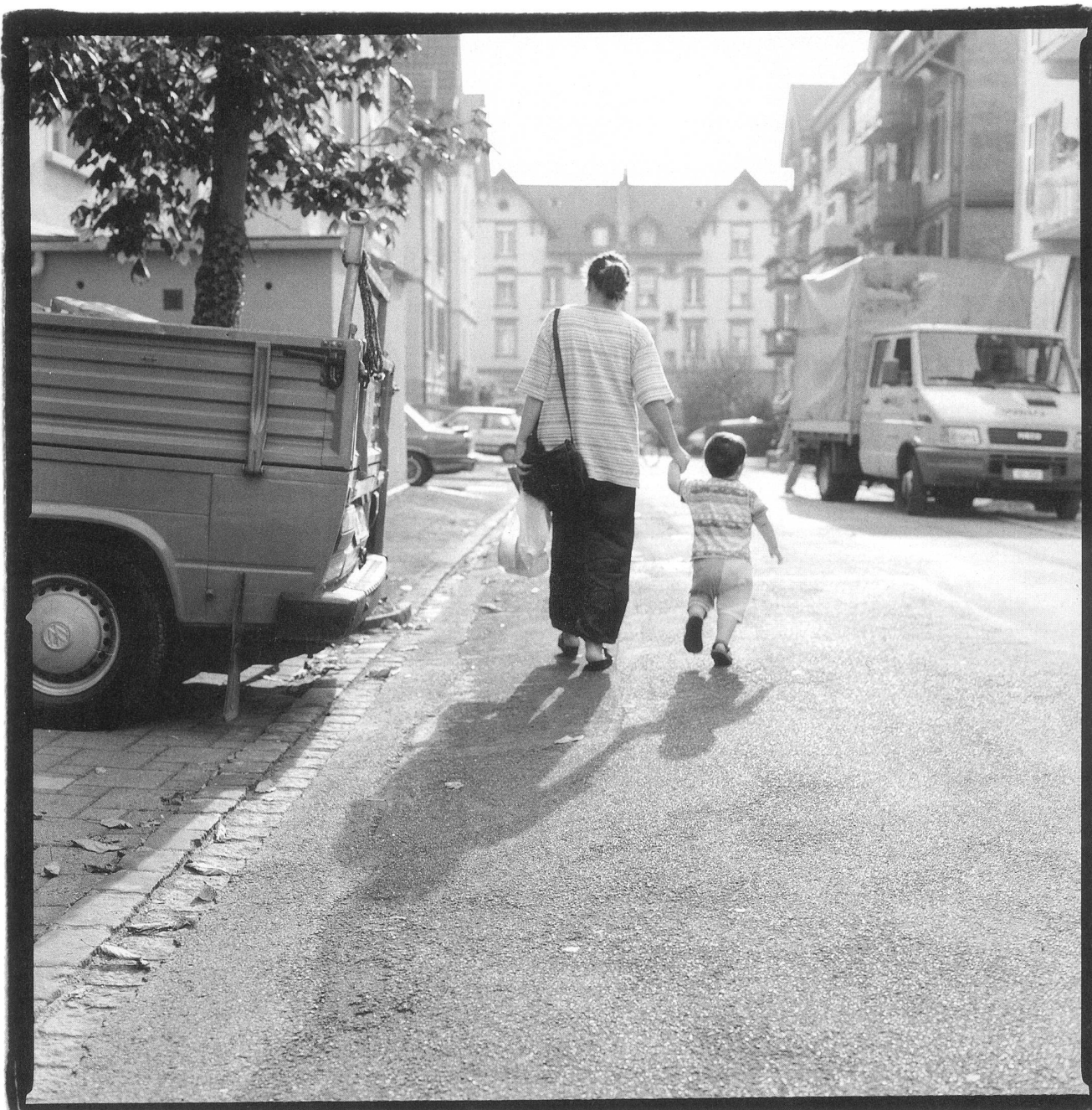
17.21 Uhr, Maisenstrasse