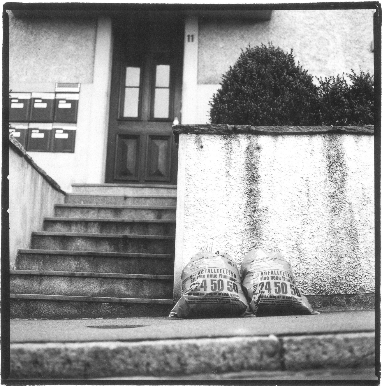
8.23 Uhr, Ilgenstrasse