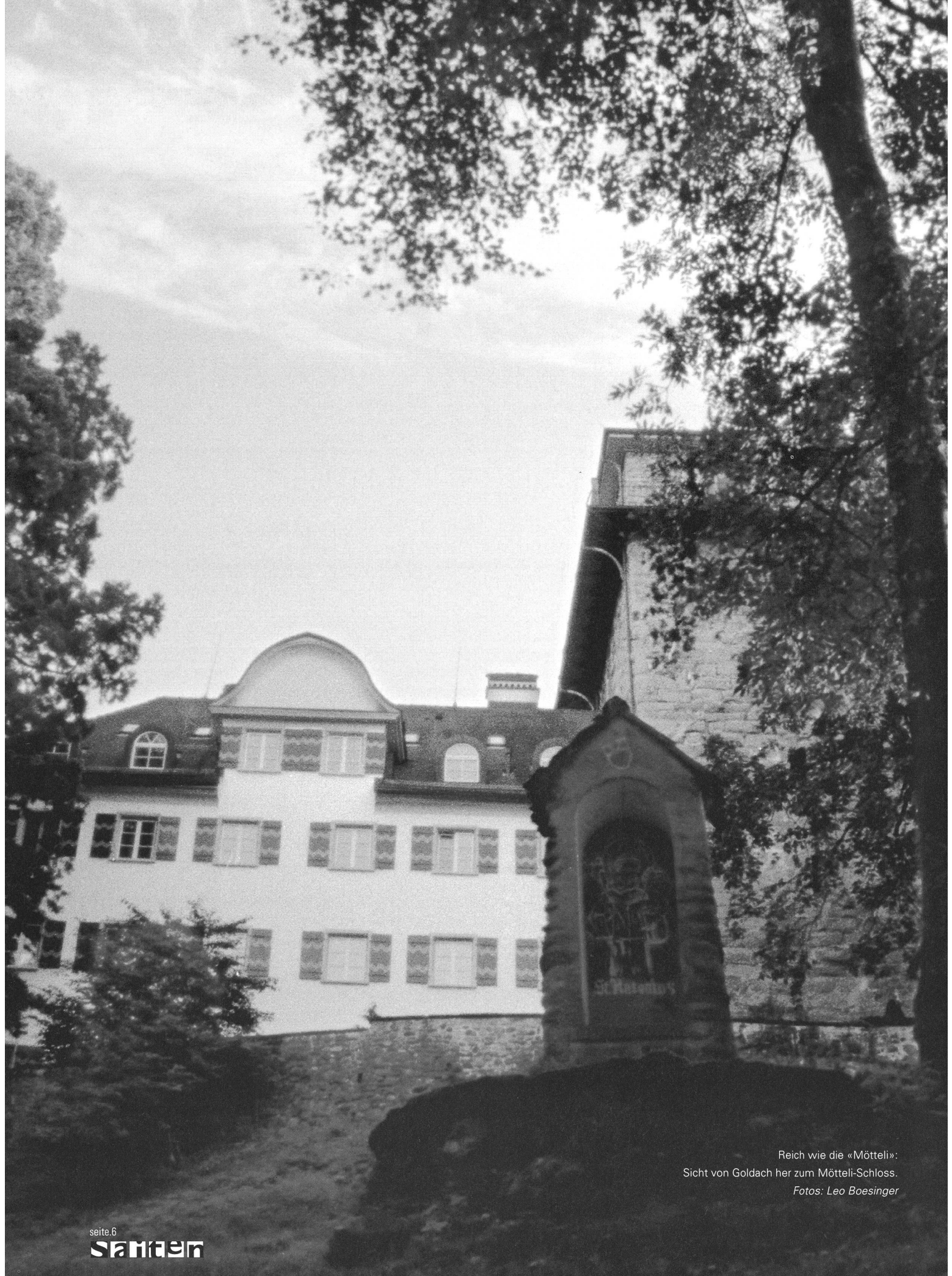
Reich wie die «Mötteli»: Sicht von Goldach her zum Mötteli-Schloss.