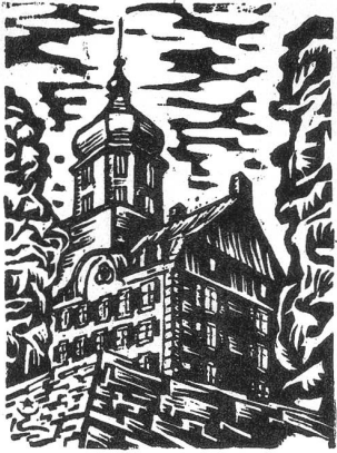
Grüne Katze auf Schloss Grünenstein, Balgach, 13. VI 97