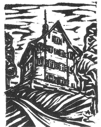
Grüne Katze auf Schloss Dottenwil, Wittenbach, 18. VI 99