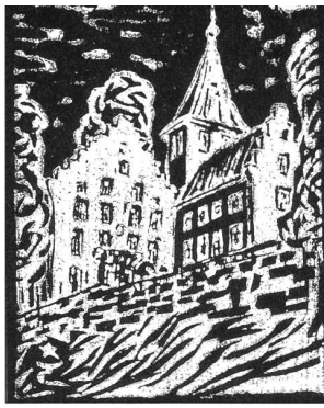
Grüne Katze auf Schloss Wartegg, Rorschacherberg, 1. IV 99