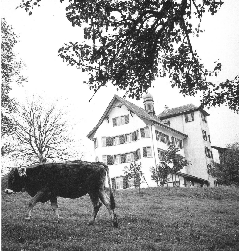
Stationen der «incredible green cat company»: Schlösser Wartegg, Grüenstein und Dottenwil. (von links nach rechts)