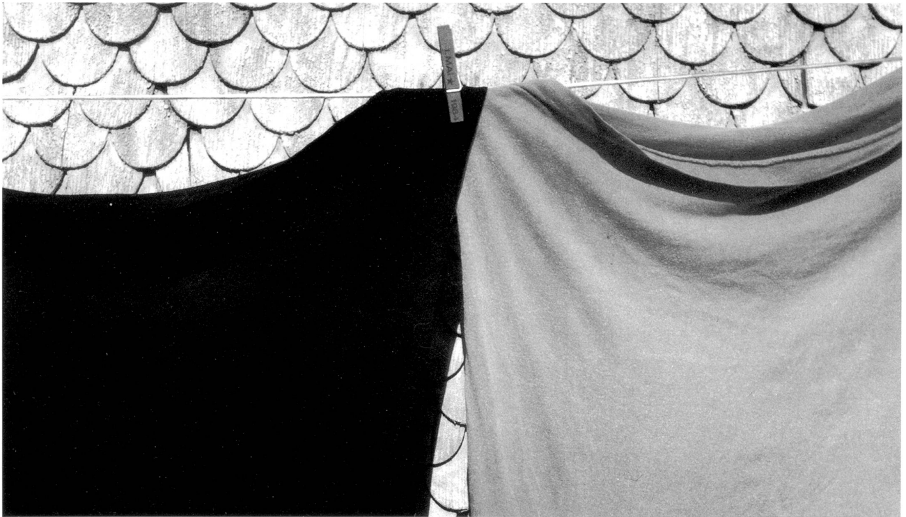
Ländliche Idylle am Stadtrand.

tungen in Palmen. Manchmal nahm er seinen Papagei auf der Schulter mit in den Ausgang.