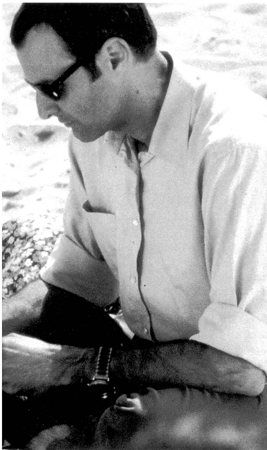
Szene aus «Rien à faire».

genaue Spieldaten siehe Veranstaltungskalender