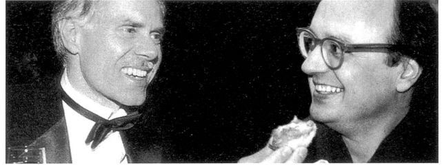
«Alles Gute zum Neuen Jahr und zu Deiner Island-Ausstellung!» wünscht Bundesrat Moritz Leuenberger und küsst dem Ostschweizer Starfotografen Stefan Rohner herzlich auf beide Wangen