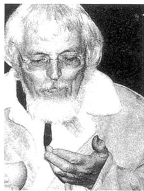
Kam mit seinem Sport-wagen direkt von Paris: Der Philosoph Paul Virilio

doch um eine höchst künstlerische Seele, wovon auch sein Bei-trag im re public-Ka-talog (eine aktuelle Version des Abend-mahls) zeugte. Zwar wurde es ganz schön eng in der August-Bar – dem angereg-ten Diskutieren unter den Gästen tat dies keinerlei Abbruch.