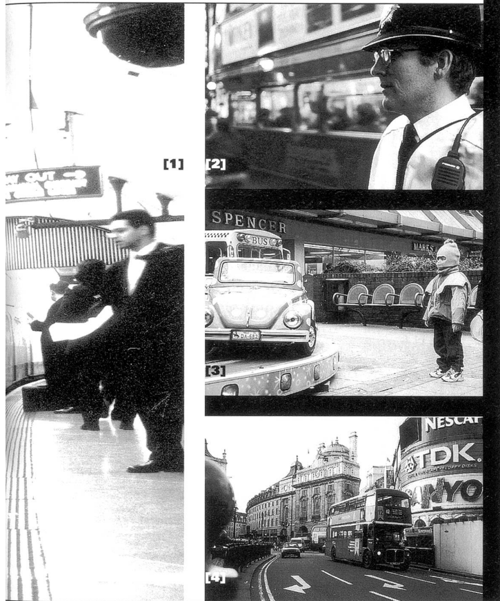
[1] Die Londoner U-Bahn [2] Polizeipräsenz in Soho [3] Vorstadt Harrow [4] London City

weitere anderthalb Stunden Perfektion, wieder rausgeschleust, diesmal in Richtung Theatershop: die Merchandising-Artikel warten. Doch verglichen mit der Webberschen Musicalindustrie ist die RSC immer noch heile Welt.