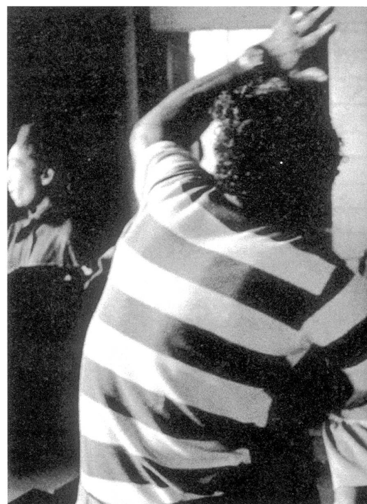
Karibischer Alltag – Bild aus dem Booklet «Sound and Pressure. Volume two»