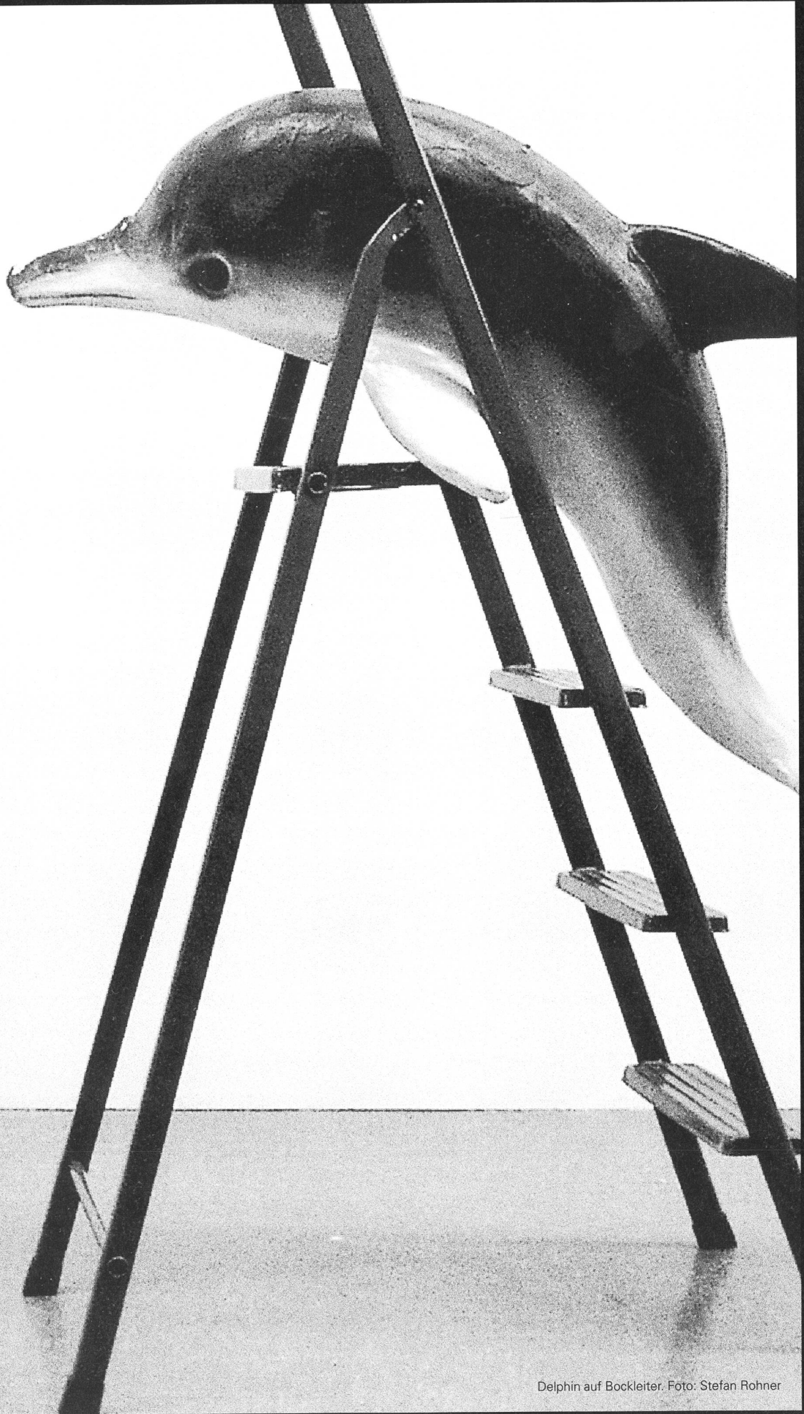
Delphin auf Bockleiter.