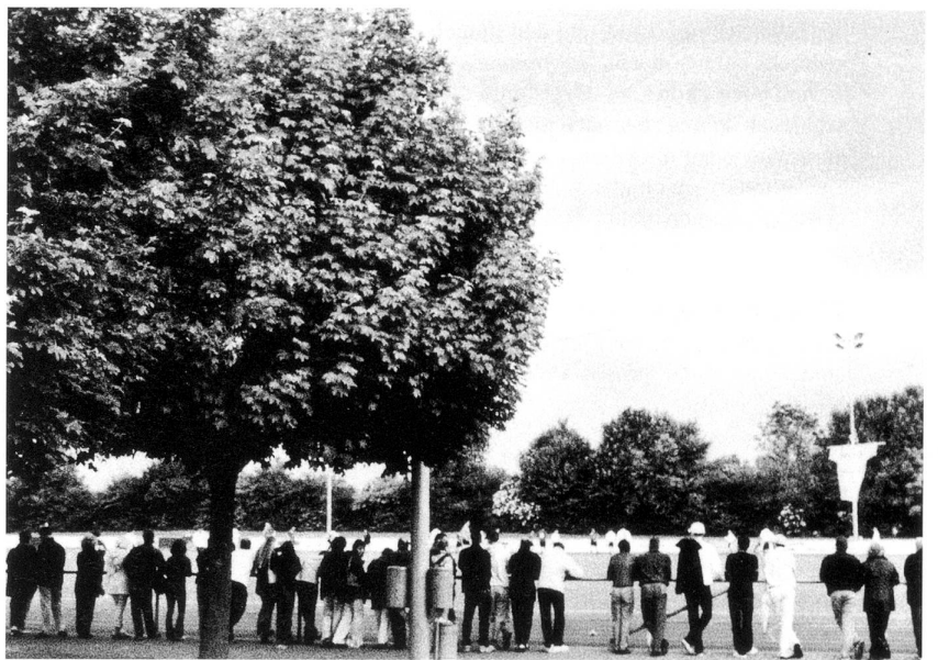
Sportplatz Uzwil: Herisau – Uzwil 2:2. (oben) Autobahnschlängeln (unten)