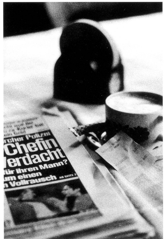
Im Hirschen, Henau.