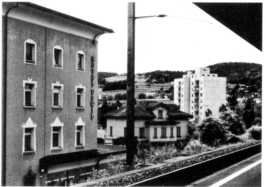
Bahnhof Uzwil und Hotel Uzwil.