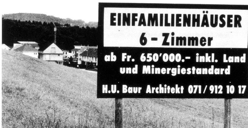
Wohnen im Irgendwo. (oben) Uzwil vom Zug aus. (unten)