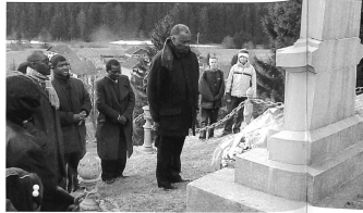
Als der Strom des indischen Schweisses plötzlich versiegt war unter der Sonne/Als der Goldtausch auf dem Markt schwermte den letzten Tropfen Indierblut/ So dass kein einziger Indio verlebte in Reichweite der Goldgruben/ Während man sich dem Muskelruss Afrika zu. [René Depestre: «Mineral noir»]

Toussaint Louvertures Vater soll ein Häuptling oder König gewesen sein und wurde als Sklave von Afrika (aus der Region des heutigen Benin) nach Saint Domingue verfrachtet. So funktionierte der sogenannte «Dreieckshandel»: billige Textilien und Krümskräms, Gebrauchsgüter, Waffen und Alkohol von Europa nach Afrika. Tausch gegen schwarze Sklavinnen und Sklaven. Fahrt über den Atlantik in die «Neue Welt» und Austausch gegen Kolonialprodukte, welche auf Plantagen mit Sklavenarbeit produziert und schliesslich nach Europa transportiert wurden. Auf einer solchen Plantage wurde Toussaint Louverture 1743 auf Saint Domingue geboren. Bis 1776 lebte und arbeitete er auf der Plantage «Breda», welche ihm auch seine vorevolutionären Namen gab: François Dominique Breda.