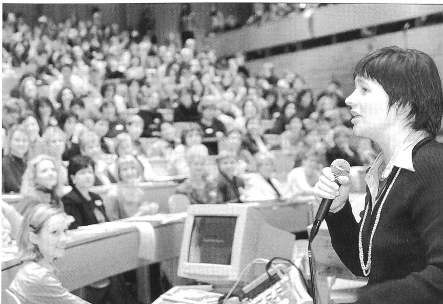
Bild: Die jährliche FrauenVernetzungsWerkstatt wird von 700 Frauen besucht.

erika.bigler@ostschweizerinnen.ch und veronika.longatti@ostschweizerinnen.ch