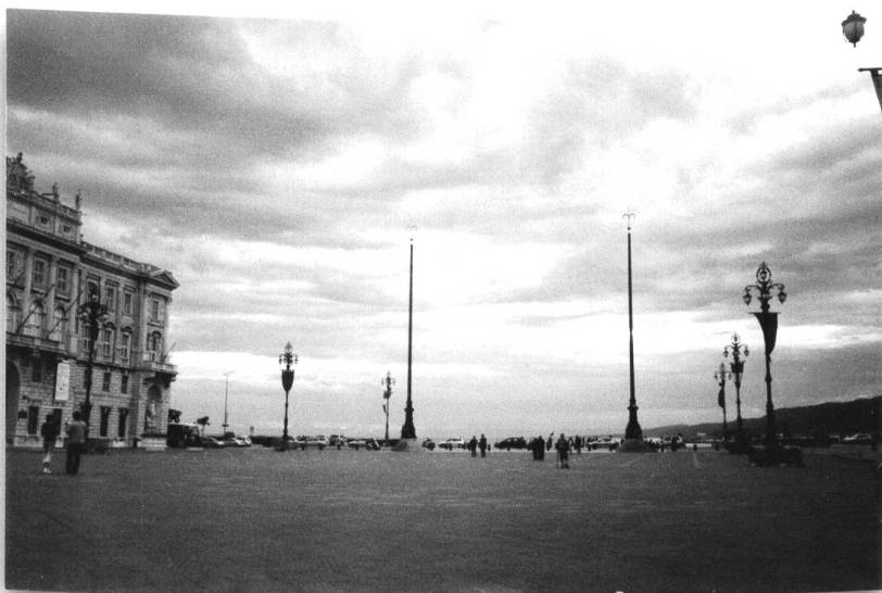
Triest, 6. Juni 2004