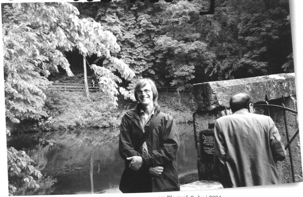
am Blautopf, 9. Juni 2004