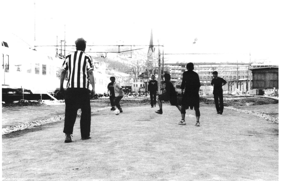
Die Stadt zurückerobern, Plan St.Gallen: Spontane Fussballmatches hinter dem Hauptbahnhof.

In der Theorie definiert sich die Stadt als ein Sammelsurium von Lebensformen jeglicher Art, nicht als lebensfeindlicher Raum. Dementsprechend gab es immer wieder Ideen, die Stadt im Sinne dieser offenen Vorstellung zu sehen. Etwa von Paulo Virilio, dem französischen Philosophen und Architekten. Oder von der englischen Architektengruppe Archigram. Virilio hat die Stadt einmal mit einem Ozeandampfer verglichen und gefordert, die Stadt müsse – wie der Dampfer Rettungsboote besitze – Bojen für Menschen bereitstellen, die vom sozialen Abstieg bedroht sind: Einrichtungen, wo Menschen hingehen und ihre Existenz neu organisieren können. In eine ähnliche Richtung zielte auch Archigram. Die Gruppe sah die Stadt gegliedert nach Hardware und Software. Hardware – Plätze, Strassen usw. – verleihen der Stadt Identität. Mit der Software – mobilen Einrichtungen – dagegen hat eine Stadt die Möglichkeit, kurzfristig auf gesellschaftliche Veränderungen zu reagieren. Genau dafür hat Archigram ein ganzes Repertoire von Erfindungen gemacht, zum Beispiel einen >>>