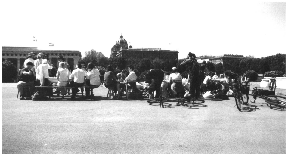
Die Stadt zurückerobern, Plan Wien: Seit 1998 wird auf Initiative des Künstlers Friedemann Derschmidt im öffentlichen Raum nach dem Schneeballprinzip gefrühstückt: Wer eingeladen wird, macht später selbst einen Tisch auf. Passanten und Polizisten sind herzlich willkommen.