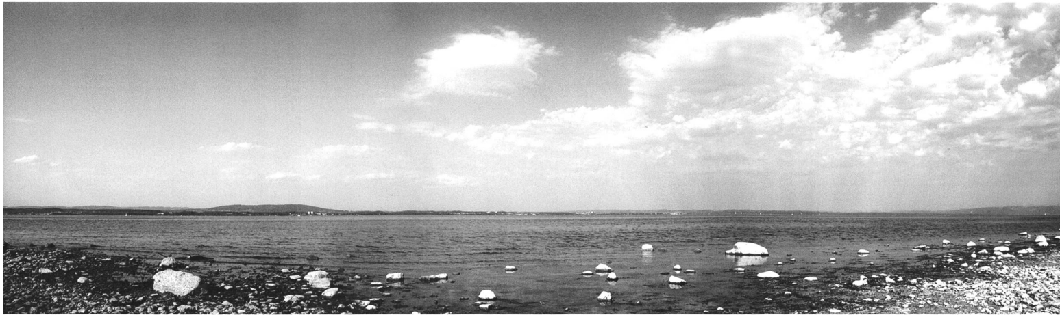
Gleich hinter dem Bodensee liegt Griechenland. Bestimmt.