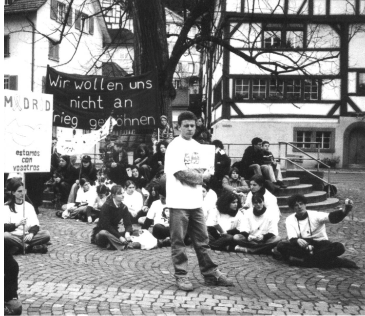
Friedensdemo am 20. März auf dem Gallusplatz, ein Jahr nach Beginn des Irakkriegs.

100 Jahre Vadiandenkmal. Stadtführung und Speis und Trank mit dem Reformator, 2. Juli, 18 Uhr, Vadiandenkmal