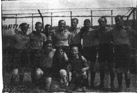
Die erste Mannschaft des Arbeiter-F.C. Rapid St. Gallen

wechselten zu uns, weil sie mehr Bindungen zu uns als St. Gallen-Östler besaßen. Dazu kam, dass die damaligen ausländischen Profis bei St. Gallen ein Monatsgehalt von 300 bis 400 Franken bezogen. Der Hafner und Kriessmer bezogen nichts, man putzte ihnen vielleicht die Fussballschuhe, stellte Leibchen zur Verfügung, den Platz. Das alles bekamen sie aber bei uns auch. Wir haben aber auf alle Fälle nicht beim SFAV mitgemacht. Wir haben nur Freundschaftsspiele ausgetragen gegen die Reserven des FC St. Gallen und FC Brühl. Aber Gegner fanden wir überall, weil diese damit eine Trainingsmöglichkeit hatten. Denn im SATUS gab es wenig Gegner, das waren so fünf oder sechs. Auch das Training war wenig geregelt. Der eine kam eine Stunde später und «gingte» mit, womöglich noch in Zivilschuhen. Das war eine andere Zeit als heute.»