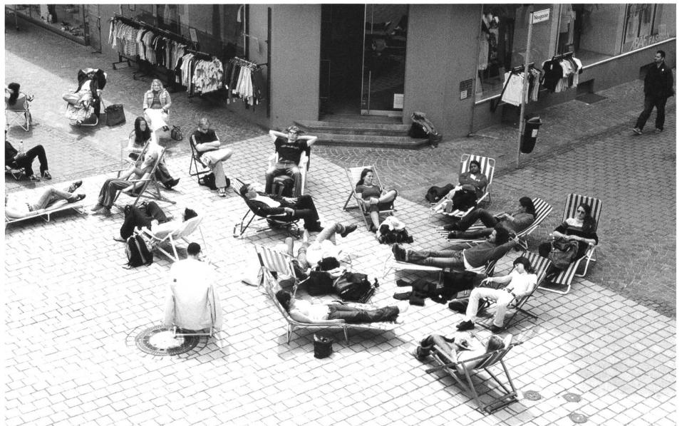
Die Stadt zurückerobern, Plan Konstanz: Das Atelier für Sonderaufgaben lobt gemeinsam mit einer Schulklasse die öffentliche Siesta.