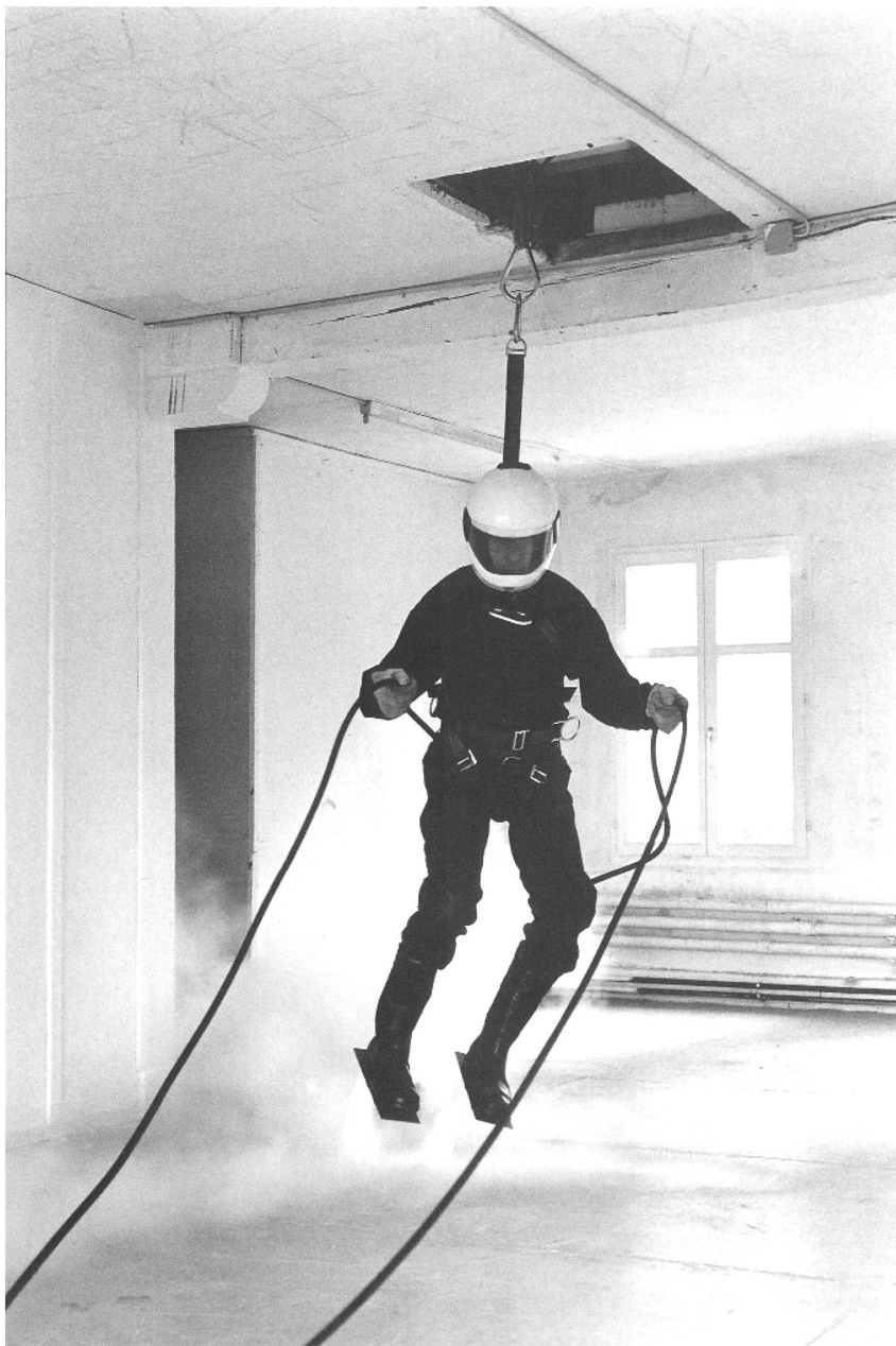
Roman Signer Schweben / Versuch im Atelier, 1995 CHF 3'000.-