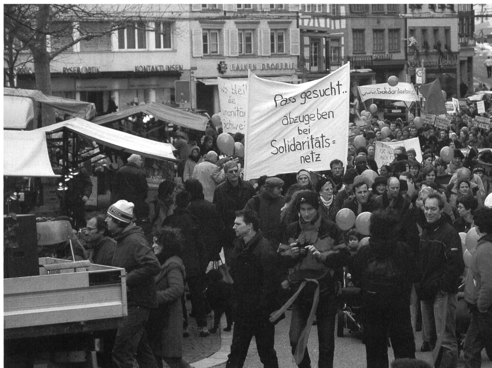
12. März 2005 in St.Gallen: Mehrere Personen demonstrieren auf den Aufruf des Solinetzes gegen Verschärfungen im Asylwesen.