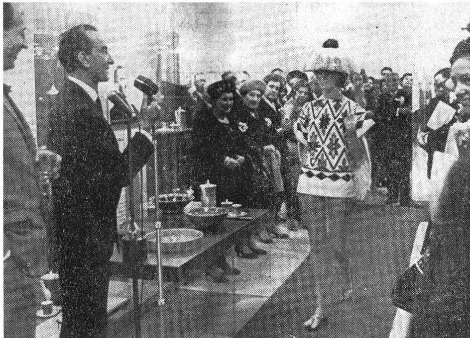
Noch eine Demonstration der modernen Welt: Der italienische Modeschöpfer Emilio Pucci präsentiert seine neueste Kollektion anlässlich der Eröffnung des Neumarktes 1. Bild aus der Ostschweiz vom 21. März 1963.

In wirtschaftlicher Hinsicht ist der Neumarkt bis heute eine Erfolgsgeschichte. Fast vergessen jedoch und unter der alltäglich-praktischen Benutzung vergraben ist seine Bedeutung als städtebaulicher und mentaler Wendepunkt in der St.Galler Stadtgeschichte. So sehr hat man sich an den «siebten Himmel der Einkaufsfreuden» gewöhnt, dass die eigentlich monumentale Grösse der Anlage quasi unsichtbar geworden ist. Eher noch nimmt man den Wechsel der Geschäfte wahr – ein Prozess, durch den sich das Einkaufszentrum ständig erneuert und verändert. Mit der gleichen Nostalgie wie bei der wirklichen Stadt erinnern sich die Stadtbewohner an das Vergangene, das dem Neuen Platz gemacht hat: An den ersten Pick Pay im Untergeschoss, der die Kunden durch ein schlangenartiges Regalsystem in Ein-Weg-Richtung geschleust hat, an das einstmals mondäne Modeverkaufshaus Spengler, an das Cafe Bajazzo, das von seinem eigenen Betreiber in Brand gesteckt wurde, oder an die sechseckigen Sitzbänke in der 1. Etage des Neumarkt 1, die wohl im Hinblick auf den Wegweisungsartikel schon vor Jahren präventiv entfernt wurden. Andere Dinge ändern sich nie. Die Migros ist seit dem ersten Tag der grösste Mieter: Die Lebensmittelabteilung verbindet unterirdisch Neumarkt 1 und 3, das Migros-Restaurant im ersten Stock