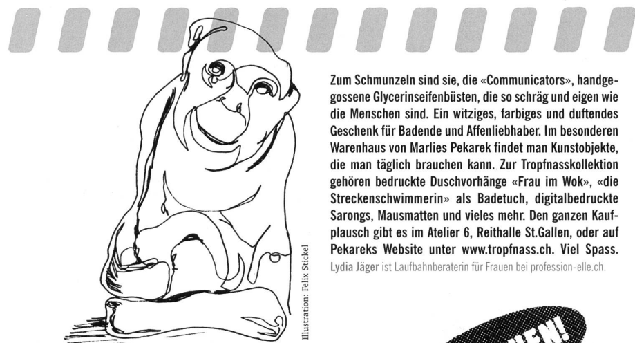
Illustration: Felix Stiekel

Burgauer identifizierte sich voll und ganz mit seiner Stadt und ihren Bewohnerinnen und Bewohnern. Er versicherte, die städtische Bevölkerung habe sich gegenüber seinem Judentum nie negativ geäussert. Seiner Mei- nung nach war Bamberger, der Fremde, als