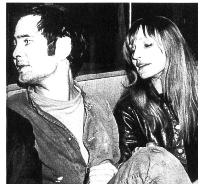
Andreas Baader und Gudrun Ensslin im Oktober 1968 während dem Gerichtsprozess zum Kaufhausbrand in Frankfurt.

Die Vorgeschichte zum «Frankfurter Kaufhausbrand» ist komplex. Als im Mai 1967 in einem Kaufhaus in Brüssel ein Grossbrand ausbrach, wurden mehr als 250 Menschen getötet und Hunderte verletzt. In den folgenden Tagen verteilte die «Kommune 1» in Ber-