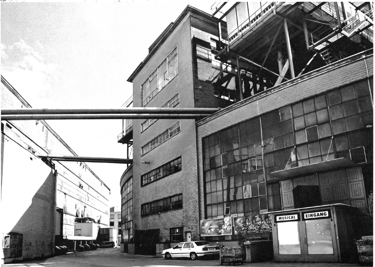
Heute sorgen Musicals für den Glanz.