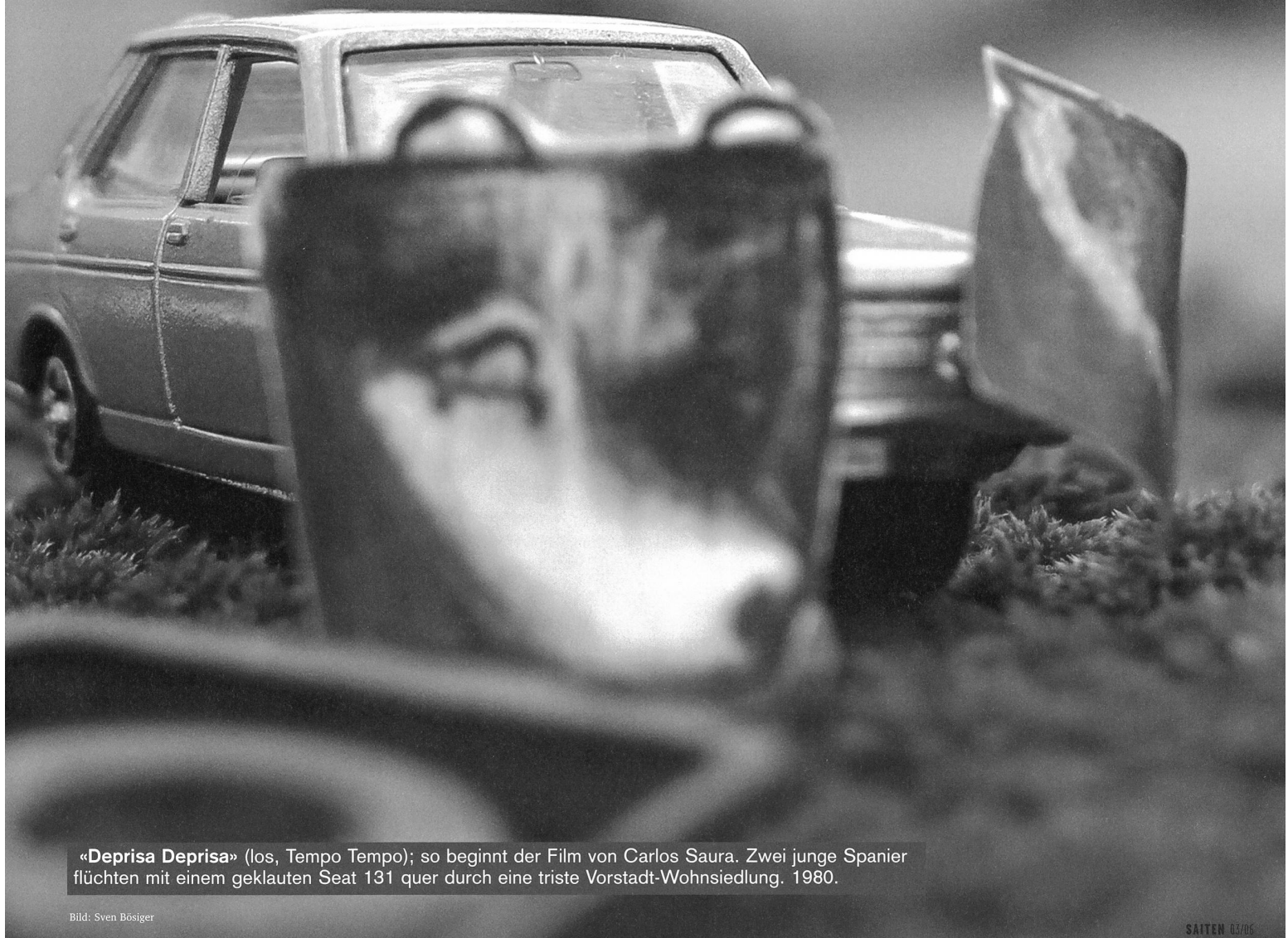
« Deprisa Deprisa » (los, Tempo Tempo); so beginnt der Film von Carlos Saura. Zwei junge Spanier flüchten mit einem geklauten Seat 131 quer durch eine triste Vorstadt-Wohnsiedlung. 1980.