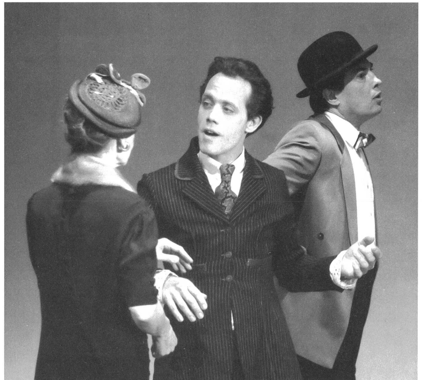
Abenteuerliche Geschöpfe aus Walsers Bleistiftgebiet.

Premiere: Mi, 9. August, 20 Uhr. Weitere Vorstellungen: bis Sa, 26. August, täglich ausser Mo, jeweils 20 Uhr, So, jeweils 18 Uhr. Theaterbeiz ab 18.30 Uhr (So 16.30 Uhr). Mehr Infos und Tickets: parfin@bluewin.ch oder 071 245 21 10.