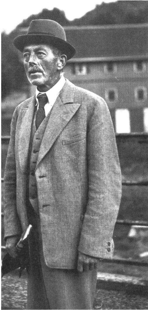
Als potentieller Vagabund verdächtig: Robert Walser.