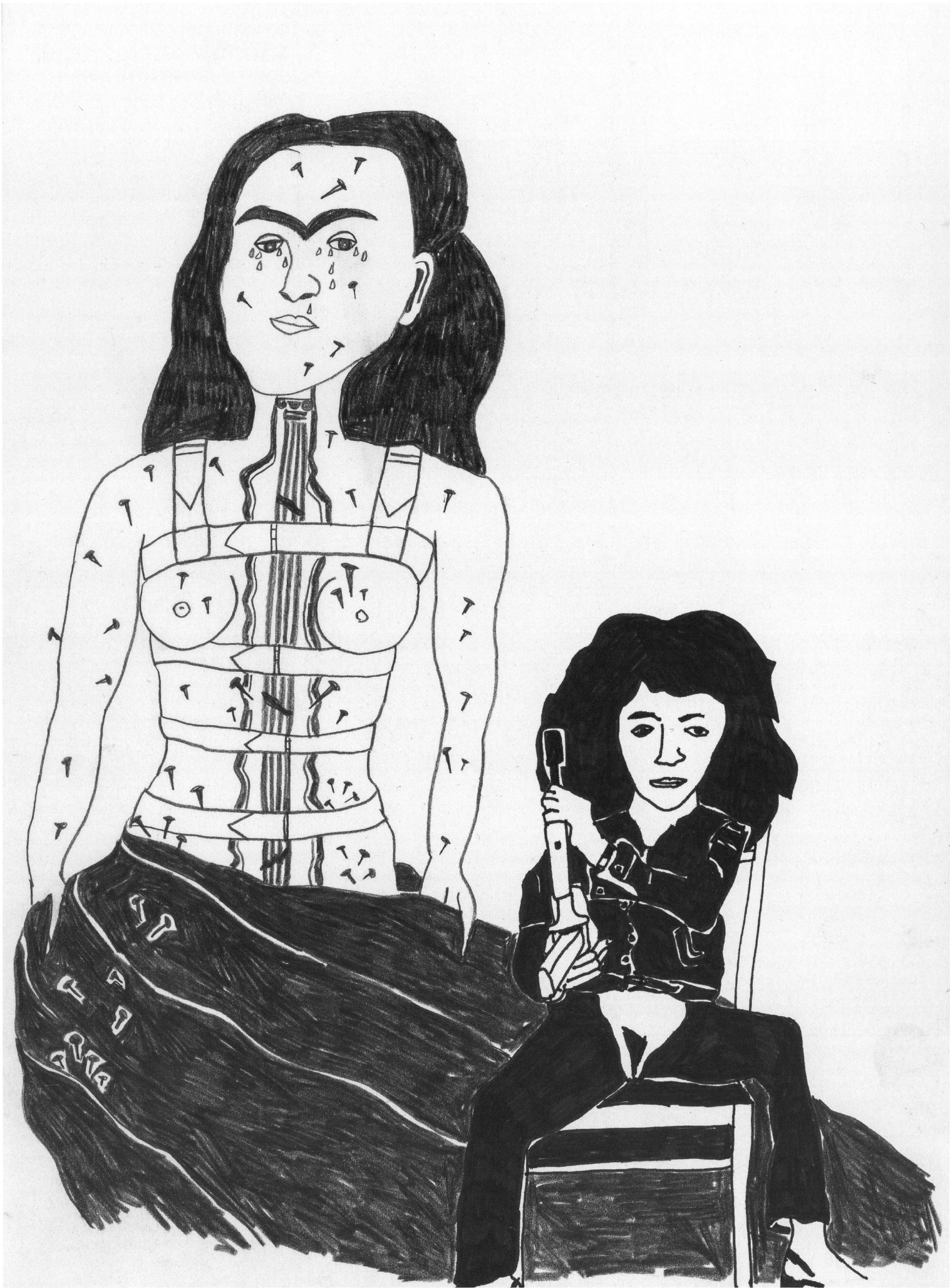
Illustration: Eva Rekafe. Nach Werken von Frida Kahlo und Valie Export.