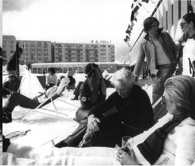
Die Inszenierung des Soziallebens: Vorderseite des Hotels in «Le Flaine». Bild: aus «Marcel Breuer, Design und Architektur»

Gefühlswelt auf den Kopf stellt, findet nicht in der geordneten Umgebung des Alltags statt, sondern an einem abseitigen Ort. Einige Beispiele: Die unbescholtene Hofdame in «Gefährliche Liebschaften», einem zynischen Sittengemälde der französischen Aristokratie, verfällt dem Verführer in den ausschweifenden Anlagen des feudalen Parks. Tschechows Dramen spielen mit Vorliebe auf einem Landsitz, wo sich das Personal in der Hitze des Sommers in emotionale Wirrungen verstrickt. Der unglückliche Doktor Schiwago erlebt sein verbotenes Liebesglück in einer verschneiten Landvilla, weit weg vom revolutionären Moskau. Jean-Luc Godard wiederum wählt als Schauplatz seines Eifersuchtsdramas «Le Mépris» die Casa Malaparte, ein spektakuläres Ferienhaus auf einem Felsen vor Capri. Und auch der erfolgreichste Liebesfilm der achtziger Jahre «Dirty Dancing» spielt – wo auch sonst? – in einer Ferienkolonie.