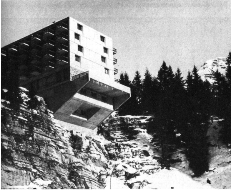
Die Inszenierung der Natur: rückwärtige Ansicht des Hotels in «Le Flaine». Bild: aus «Ferienarchitektur»