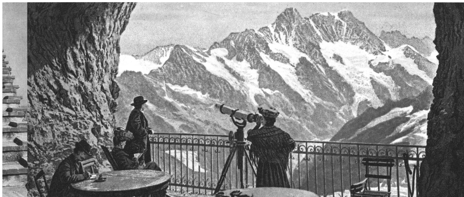
Gepflegtes Schaudern: Das Grossbürgertum bestaunt die Schweizer Bergwelt.

Dass sich die verborgene Funktion des historischen Gartens mit der des zeitgenössischen Feriendomizils deckt, lässt sich an einem einfachen Beispiel ablesen: dem amourösen Abenteuer. Literatur, Theater und Film greifen auf die implizite Bedeutung dieser Orte zurück, wenn es darum geht, für das Liebesdrama die passende Kulisse zu finden. Das Aufwallen der Leidenschaft, das die