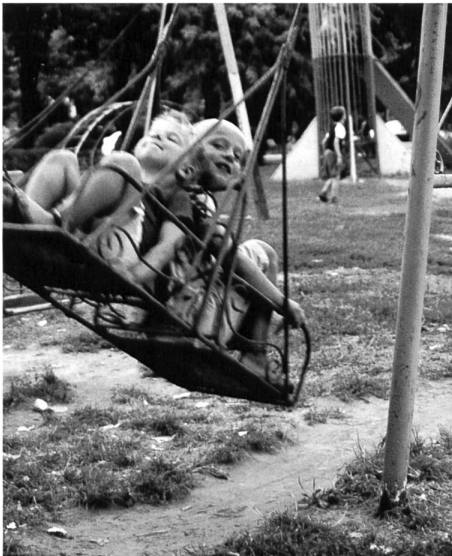
Nicht euronormiert, sondern rege genutzt: Spielplatz in Vidin.