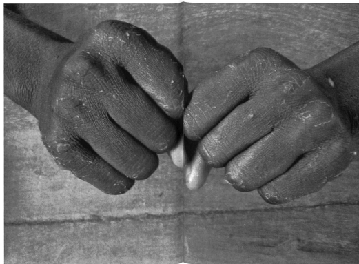
... zehn Tage auf einem Fischerboot und Meersalz hinterliessen Spuren ...