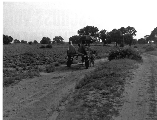
... doch Europa wollte nicht, dass er leibet.