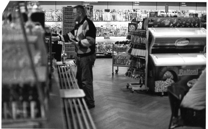
Vor lauter Gestellen erkennt man den Buffetsaal kaum wieder: Am Hauptbahnhof Rorschach ersetzt ein Buffet-Kiosk das Erstklass-Buffet