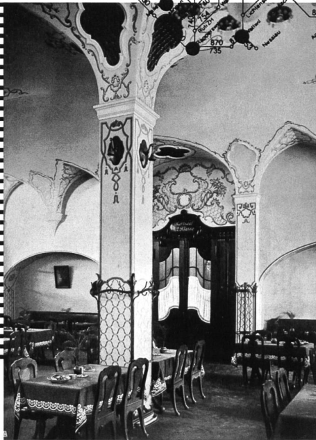
Ist schon zu seiner Zeit als «Bijou» bezeichnet worden: das St.Galler Erstklassbuffet.