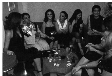
Greifen im Notfall auch zu Eimer und Lappen: marokkanische Stammgäste.