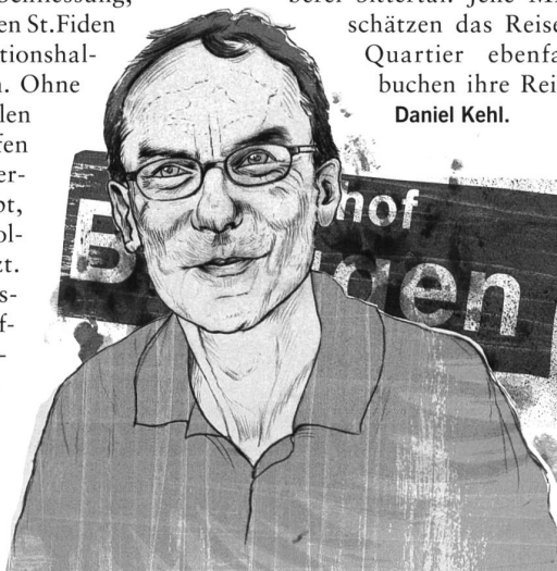
Illustration: Rahel Eisenring