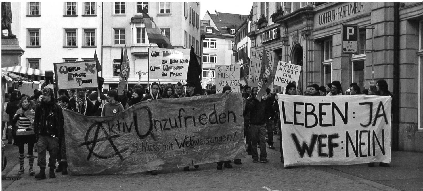
«Aktiv Unzufrieden» und Zugewandte demonstrieren 2006 gegen WEF und Wegweisungen ...