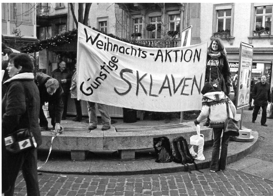
... und am Menschenrechtstag 2005 verkauften sie Sklaven.

liche Funktionen. Sie kontrollierten Ausweise, beschlagnahmten Gras und verteilten sogar Ordnungsbussen. Aktiv Unzufrieden wehrte sich gegen den «Sicherheitswahn» und lancierte eine Petition gegen die Securitas auf Dreilinden: «Wir fordern die Stadt auf, ihren Vertrag mit der Securitas AG für die Drei Weieren per sofort aufzulösen. Die Securitas verursacht unnötige Kosten, verärgern Besucher und können weder das Abfall- noch das Lärmproblem lösen. Dazu kommt, dass wir glauben, dass das Gewaltmonopol beim Staat bleiben soll.»