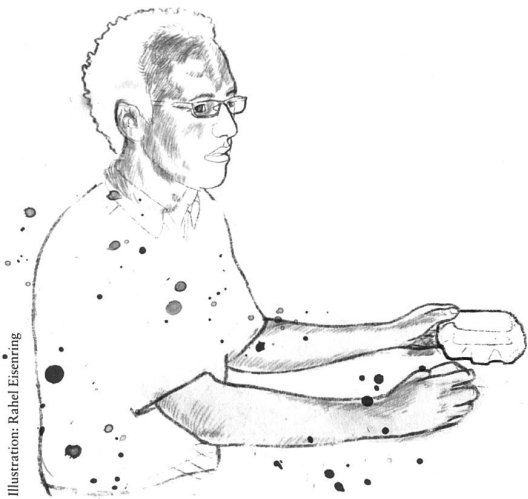
Illustration: Rahel Eisenring

Noch heute passiert es ihm, dass er auf der Strasse von ehemaligen Kunden gegrüsst wird, und sogar am Openair St.Gallen haben ihn einige Jugendliche darauf angesprochen. «Ich glaube, so etwas wird man nicht so schnell wieder los», schmunzelt er. Kathrin Haselbach