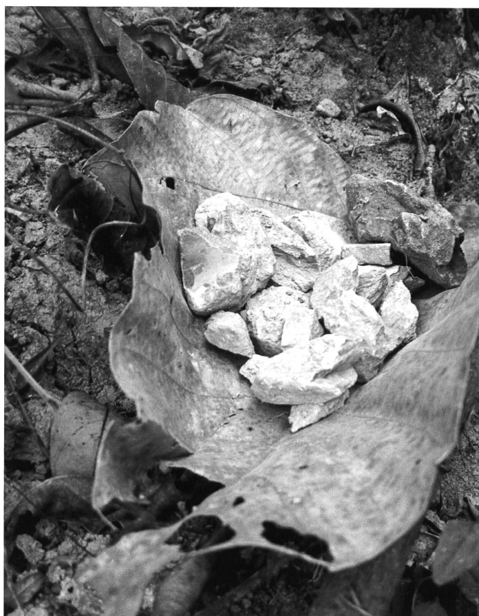
Essbare Steine mit halluzigener Wirkung.