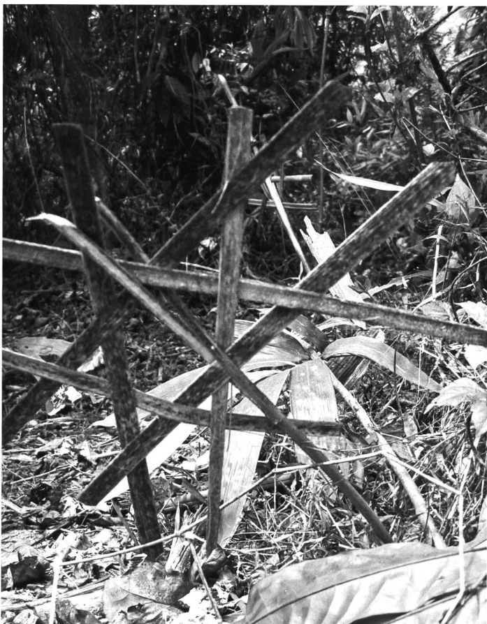
«Spirit place» ausserhalb eines Dorfes.