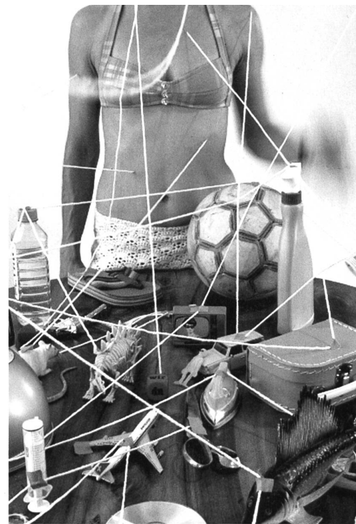
Oona Project, Zürich.

Diese Form des Tanzfestes basiert auf der Idee von Rosas, einer belgischen Tanzkompanie. Das popu-