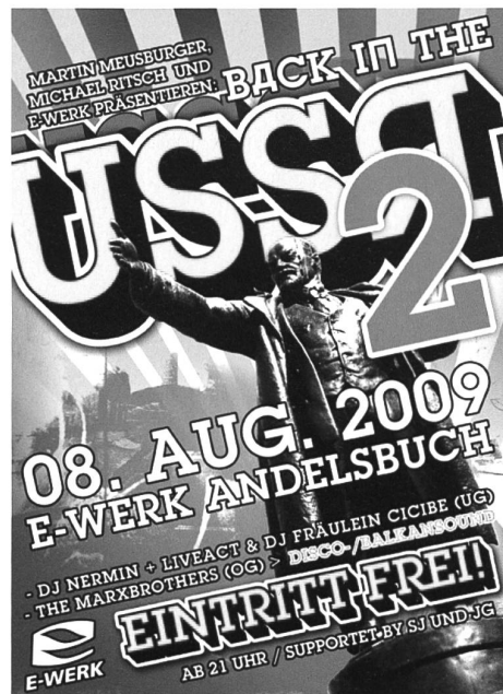
Keine Schönheit, aber werbewirksam: Flyer der Sozialistischen Jugend.