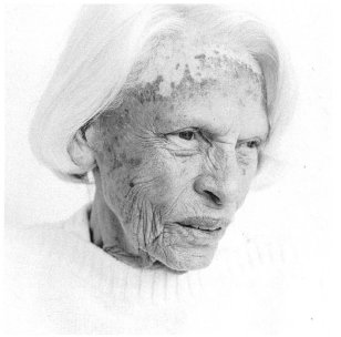
An Alzheimer erkrankte sind umgeben von einer Aura des Unantastbaren.

Gut möglich, dass die Bilder in Buchform erträglicher sind denn als Ausstellungsgut. Zumindest sind sie leichter wegpackbar als einen Quadratmeter grosse Porträts an der Wand. Aber auch die nur halb so grossen Formate gehen unter die Haut. Nicht etwa, weil die schlimmsten Seiten des Krankheitsverlaufes sensationslüstern zum Besten gegeben werden. Das Gegenteil ist der Fall. Peter Gransers Fotoarbeit ist keine Reportage im traditionellen Sinn mit schonungslosem Blick auf das Elend der Verwirrung. Es sind sorgsame Annäherungen an Menschen, streng darauf bedacht, die Würde der Dargestellten