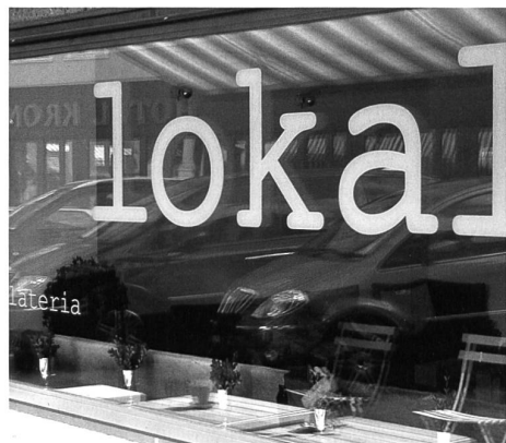
Frische Gelati statt verstaubter Uhren.

Vespas knattern übers Kopfsteinpflaster, vielleicht runter zum Sitterstrand, Leute flanieren über die Piazza, andere geniessen ihren Vino, es wird gelacht und geplaudert. Und das Beste ist, dass ich