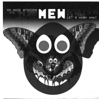
Mew. No More Stories Are Told...