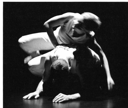
Cie. Bewegungsmelder, Vorarlberg.