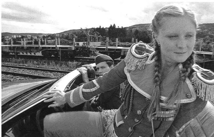
Pippilotti Rist: «Pepperminta».