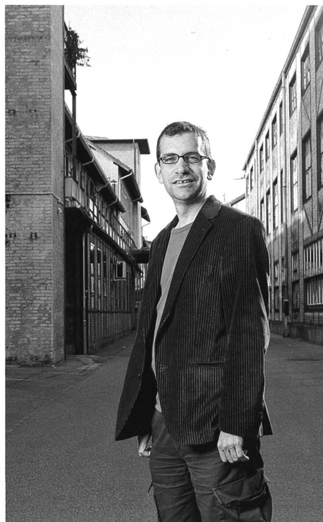
Das ist vielleicht der nächste Kulturminister der Schweiz.

Es wäre aber dieser Kolumne nicht würdig, hier unoriginelle Eigenwerbung zu betreiben. Darum denken wir jetzt ein wenig weiter. Gehen wir davon aus, dass ich tatsächlich gewählt wurde. Dies wurde möglich, da die Winterthurerinnen und Winterthurer einen der ihren als Kulturminister wollten und die Leserschaft des «Saiten» auch fleissig für mich stimmte. Ich wurde also Kulturminister, die Amtszeit war auf zwei Jahre beschränkt. Ich gab in jenem Zeitraum selbstver-