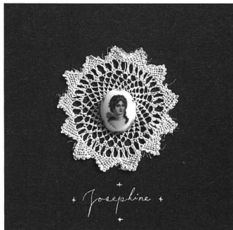
Magnolia Electric Co. Josephine.