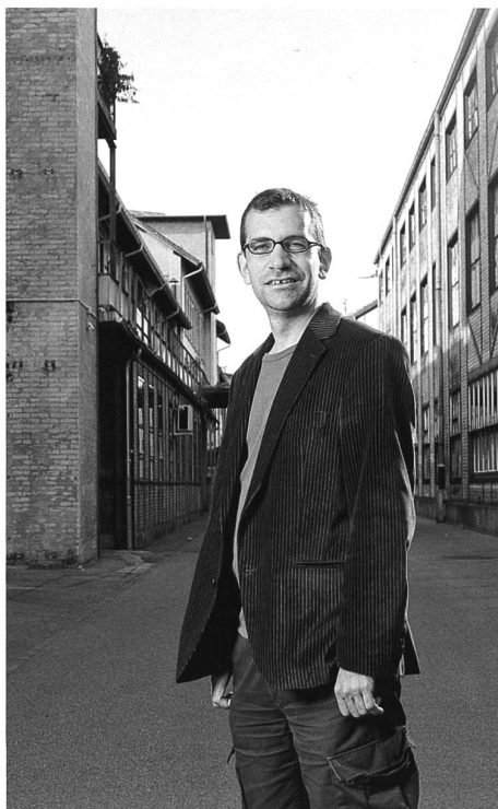
Das ist vielleicht der nächste Kulturminister der Schweiz.

Es wäre aber dieser Kolumne nicht würdig, hier unoriginelle Eigenwerbung zu betreiben. Darum denken wir jetzt ein wenig weiter. Gehen wir davon aus, dass ich tatsächlich gewählt wurde. Dies wurde möglich, da die Winterthurerinnen und Winterthurer einen der ihren als Kulturminister wollten und die Leserschaft des «Saiten» auch fleissig für mich stimmte. Ich wurde also Kulturminister, die Amtszeit war auf zwei Jahre beschränkt. Ich gab in jenem Zeitraum selbstver-