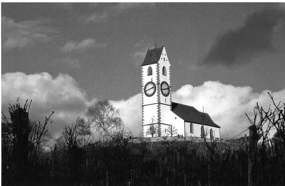
Dank dem Wein bleibt in Hallau die Kirche im Dorf.

sogar im Süden bin, wenn ich in der Libreria arbeite, denn auch die ist an dieser Piazza zu finden. Wir haben die besten Nachbarn bekommen, die man sich wünschen kann. Auguri!