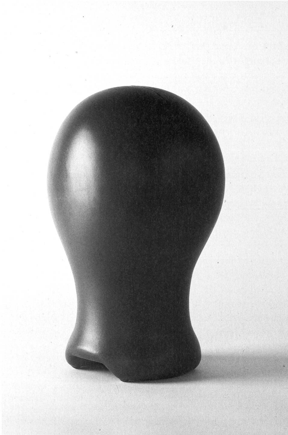
Perückenkopf, 1996 roter Kunststoff mit Öffnung, 570 mm Umfang unbekannt, Bruno