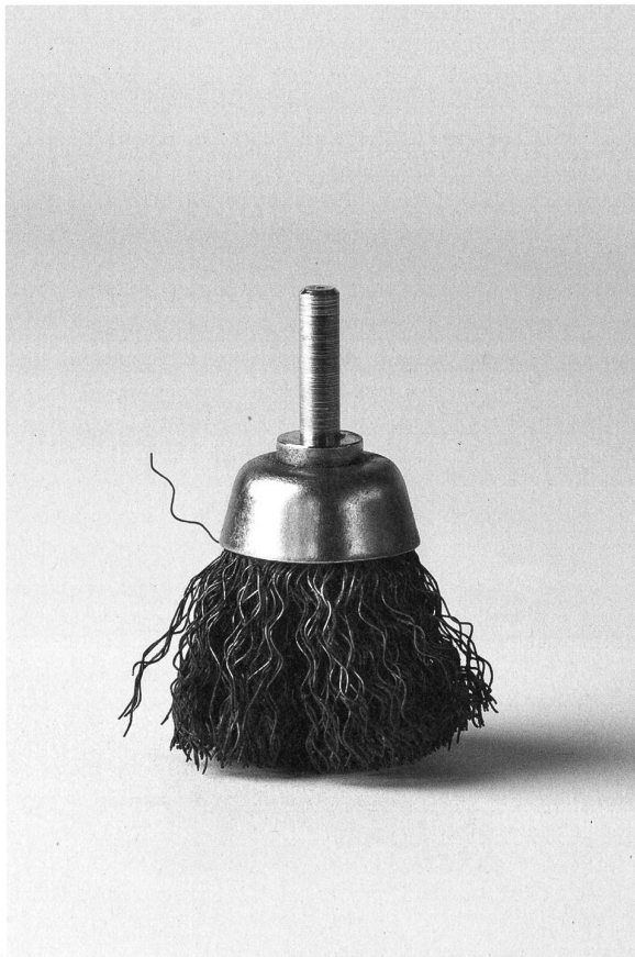
Schleifkopf "Bürste", 2001 verschiedene Metalle, 70 mm unbekannt, Saiten