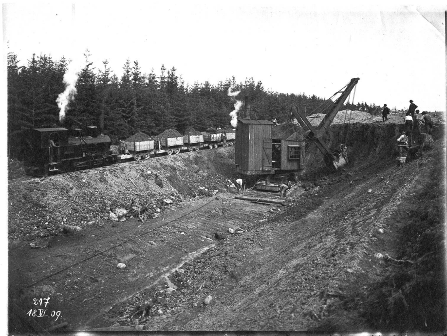
Löffelbagger an der Arbeit in der Nähe von Roggwil.