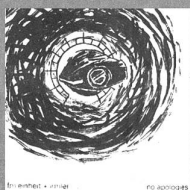
FM Einheit + Irmiler No apologies Klangbad44LP