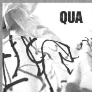
cluster Qua Klangbad45CD/LP