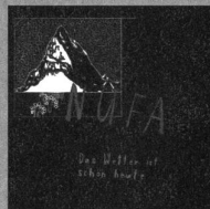
Nufa Das Wetter ist schön heute Klangbad47CD/LP