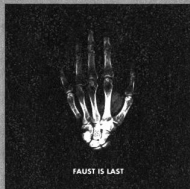
faust faust is last Klangbad 46 2CD/2LP