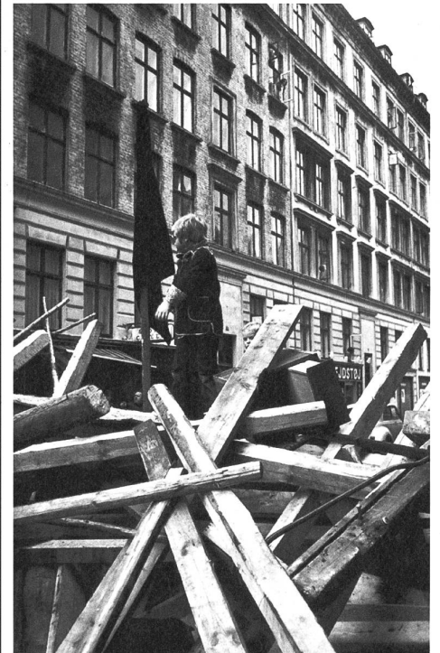
In Winterthur steigt niemand auf die Barrikaden.

Die St.Galler Kulturszene steht der Politik, gesellschaftlichen Fragen und der Stadtentwicklung sehr kritisch gegenüber. Das geht so weit, dass die St.Gallerinnen und St.Galler gedanklich gerne mal ihre Stadt niederbrennen oder von gewaltigen Explosionen träumen – die «Saiten»-Jubiläumsfeier hat es gezeigt. Währenddessen scheinen mir die Winterthurer Kulturschaffenden mit dem Leben und der städtischen Politik im Reinen zu sein. Winterthurer Kulturschaffende fallen durch Freundlichkeit auf, das Casinotheater widmet sich der satirischen Unterhaltung und ist beliebter Treffpunkt von Winterthurs High Society. Weiter gilt Winterthur als «Rock City». Aber auch von dieser Seite ist wenig von Revolte zu spüren. Wenn die Winterthurer Hausbesetzer-