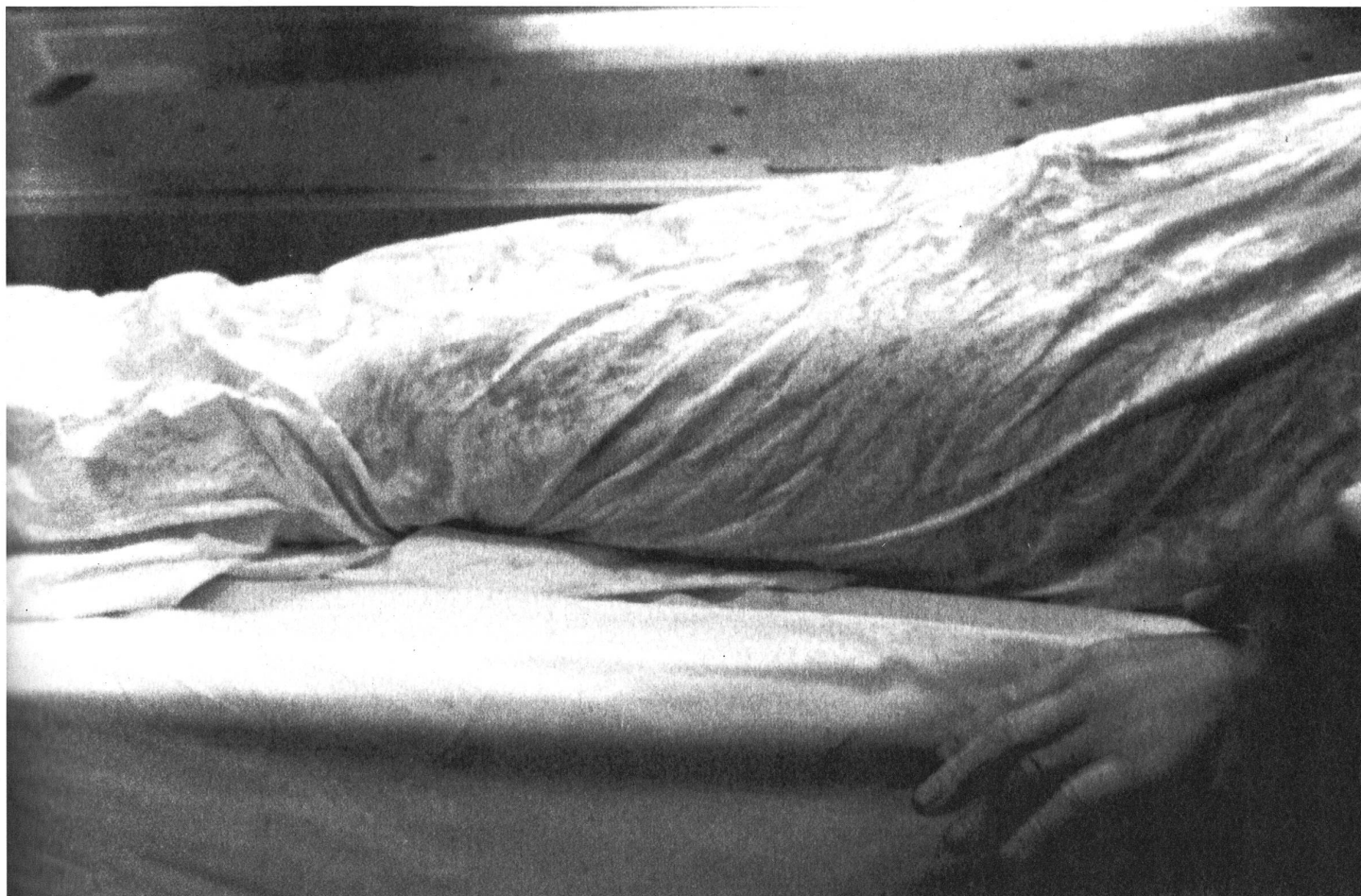
Die «neue Sichtbarkeit des Todes» muss noch ausgelotet werden.

provoziert noch immer heftige Diskussionen. Man wirft von Hagens Effekthascherei und Geldgier vor, setzt hinter die Herkunft der Leichen Fragezeichen, kritisiert, dass im Zentrum der Ausstellung die Präpariertechnik steht und nicht der Tod. Für deutliche Bilder von Sterben und Tod sorgen heute zudem prominente und einfache Zeitgenossen, die sozusagen vor den Augen der Weltöffentlichkeit sterben – vom Papst bis zur Wachkoma-Patientin, vom Schauspieler bis zum Big-Brother-Star. Gleichzeitig haben die Bestattungsinstitute ihr Angebot erweitert. Es gibt Berg-, See- und Waldbestattungen. In manchen Ländern ist der Urnenzwang aufgehoben, die Asche eines Toten kann also zuhause aufbewahrt werden. Und auch die Palette der Darstellungs- und Erinnerungsformen am Grab ist deutlich grösser geworden. Ein illustratives Beispiel sind die neuen «Friedhof-Hits», die auf Beerdigungen gespielt werden: «Time to say Goodbye» oder «Tears in Heaven».