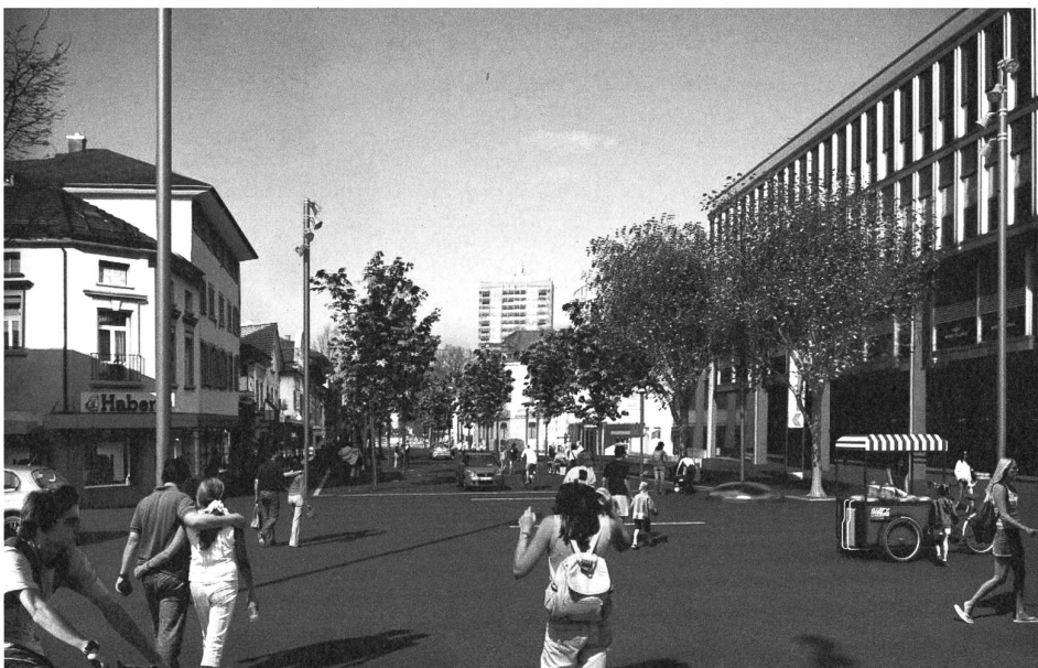
... und in der Vision der Stadtplaner.