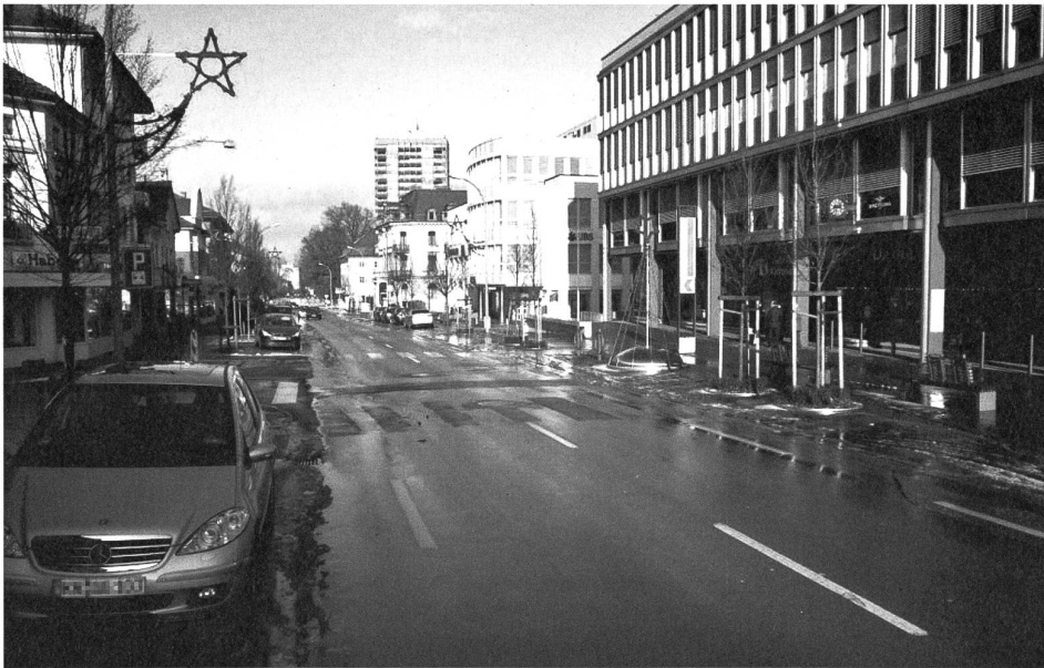
Nicht zum Flanieren gebaut: Kreuzlingens Hauptstrasse heute ...