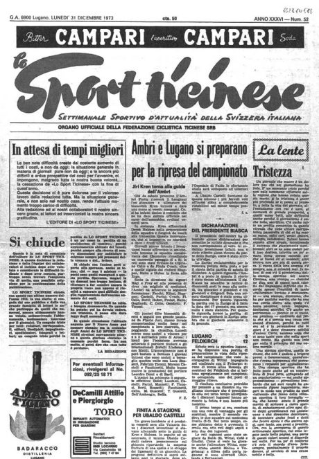
Raymond Niethammers Sammlung ermöglicht eine Zeitreise durch die Schweizer Pressegeschichte in der St.Galler Kantonsbibliothek.

heute die Tendenz zur Ein-Zeitungs-Region. Wenn zudem der journalistische Stil verflacht und ohnehin nur noch Texthäppchen für den Boulevard produziert werden, stellt sich die Frage, wie Zeitungen noch zur politischen Kommunikation und zur weiteren Demokratieentwicklung beitragen sollen. Hier eignet sich die Sammlung Niethammer als Pressegedächtnis der Schweiz, da sie über einen Zeitraum von fast dreihundert Jahren alle nur erdenklichen Tendenzen des Zeitungsjournalismus aufzeigt.