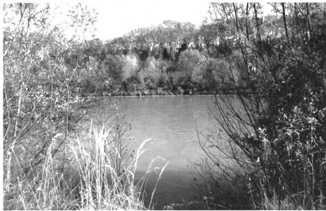
Nicht nur der Rhein ist schuld, dass sich Vorarlberger und Rheintaler Kulturschaffende zu wenig vernetzen.

Im Rheintal gibt es ein Hüben und Drüben. Dazwischen den Rhein und viel Leerraum. Die Kultur-Veranstalter wissen zwar voneinander, doch ein Miteinander gibt es kaum. An diesem Punkt setzte eine Veranstaltung im Diogenes-Theater Altstätten an. Die IG Kultur Vorarlberg und das Altstätter Theater hatten eingeladen. Zwanzig Vertreterinnen von Kulturinstitutionen und von Kulturmedien und auch Kulturschaffende waren gekommen. Das Fazit nach einer halbtägigen Diskussion war klar: mehr austauschen, mehr zusammenarbeiten; bei alledem aber behutsam vorgehen. Dass schnelle Lösungen nicht zum Erfolg führen, haben frühere Versuche gezeigt, die zwar gross angerichtet wurden, aber kaum verankert waren und schliesslich versandeten. So erstaunt es nicht, dass man vorerst kleine Brötchen backen will.