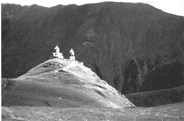
Die Dreifaltigkeitskirche Zminda Sameba.