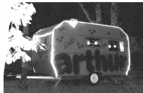
Die Reise des Wohnwagens arthur #6 durch das Toggenburg wurde von Politblicken begleitet.

Und dann hätten wir da noch die grüne Kandidatin, die zweimal pro Woche Werbung verteilt, für einen Zustupf in die Familienkasse – damit die Kinder ihrer Liebessportart nachgehen können. Ich habe es nie versäumt, Werbung zu verteilen, aber der Anschiss in der letzten Woche von einem Stammtischtypen hinter dem Restaurant Schützenhaus in Wattwil hat mich nachdenklich gestimmt. Mit dem Zeigefinger ist er auf mich zugekommen und hat gemeint, dass er den Wettbewerb in einem wöchentlich erscheinenden People-Magazin nicht gewonnen hätte, weil ich ihm die Werbung nicht fristgerecht in den Briefkasten geliefert hätte. Ausserdem sei ich mit dem Auto unterwegs und hätte noch die Frechheit, für den Nationalrat zu kandidieren. «Das werden Ihnen die Wähler nicht so schnell vergessen!» Leider weiss ich nicht, mit wem ich es zu tun hatte, der Herr hat sich nicht vorgestellt. Aber ich habe mich für die Kritik bedankt, denn ich weiss ja nicht, ob er auch fremdgeht – politisch meine ich. Das Restaurant Schützenhaus steht in der Nähe