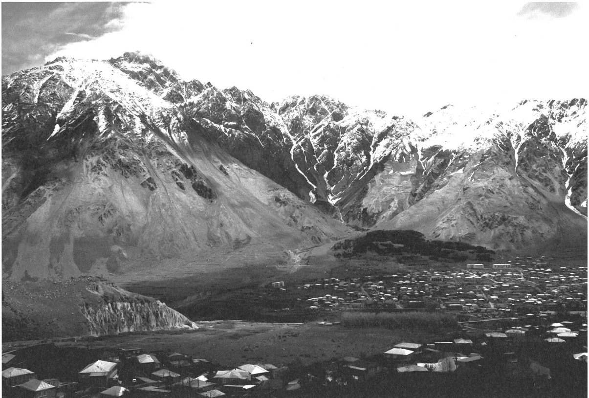
Am Fuss des Kaukasus liegt das geschichtsreiche Nest Kazbeki.