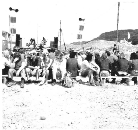
1975 wird der Bauplatz des AKWs Kaiseraugst besetzt.

Die Gegner und Kritikerinnen, die im Dokumentarfilm «Kaiseraugst» zu Wort kommen, sind diesem Glauben entwachsen. Sie verhandeln die Atomkraft über die Stichworte Nachhaltigkeit, Lebensraum und Konsumgesell-