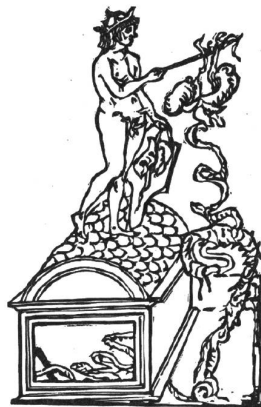
Emblem von Paul Renners Illegales Wirtshaus .

Sein laufendes Projekt «Das illegale Wirtshaus» ist zwar im Grunde weder ein Wirtshaus noch illegal, aber der Titel geht ins Ohr. Es handelt sich um eine Reihe von Menüs für geladene beziehungsweise vorangemeldete Gäste, die in der Villa des verstorbenen italienischen Künstlers Aldo Mondino in Altavilla bei Vignale auf-