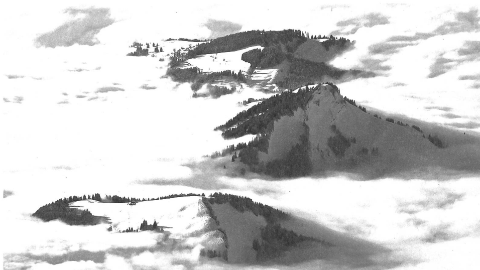
Appenzell, das Arkadien der Schweiz.

Endlich verstand ich, weshalb Gelehrte aus Zürich und deutschen Landen vor vielen, vielen Jahrzehnten das Appenzellerland in ihren sicherlich absichtslosen Reisebeschreibungen zum Arkadien der Schweiz werden liessen.