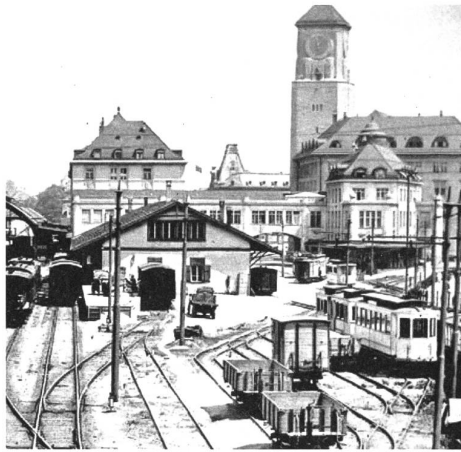
Historischer Blick auf die St. Galler Post.

Es soll eine moderne öffentliche Bibliothek als Informations- und Wissenszentrum für alle realisiert werden. Aus Kostengründen soll nicht