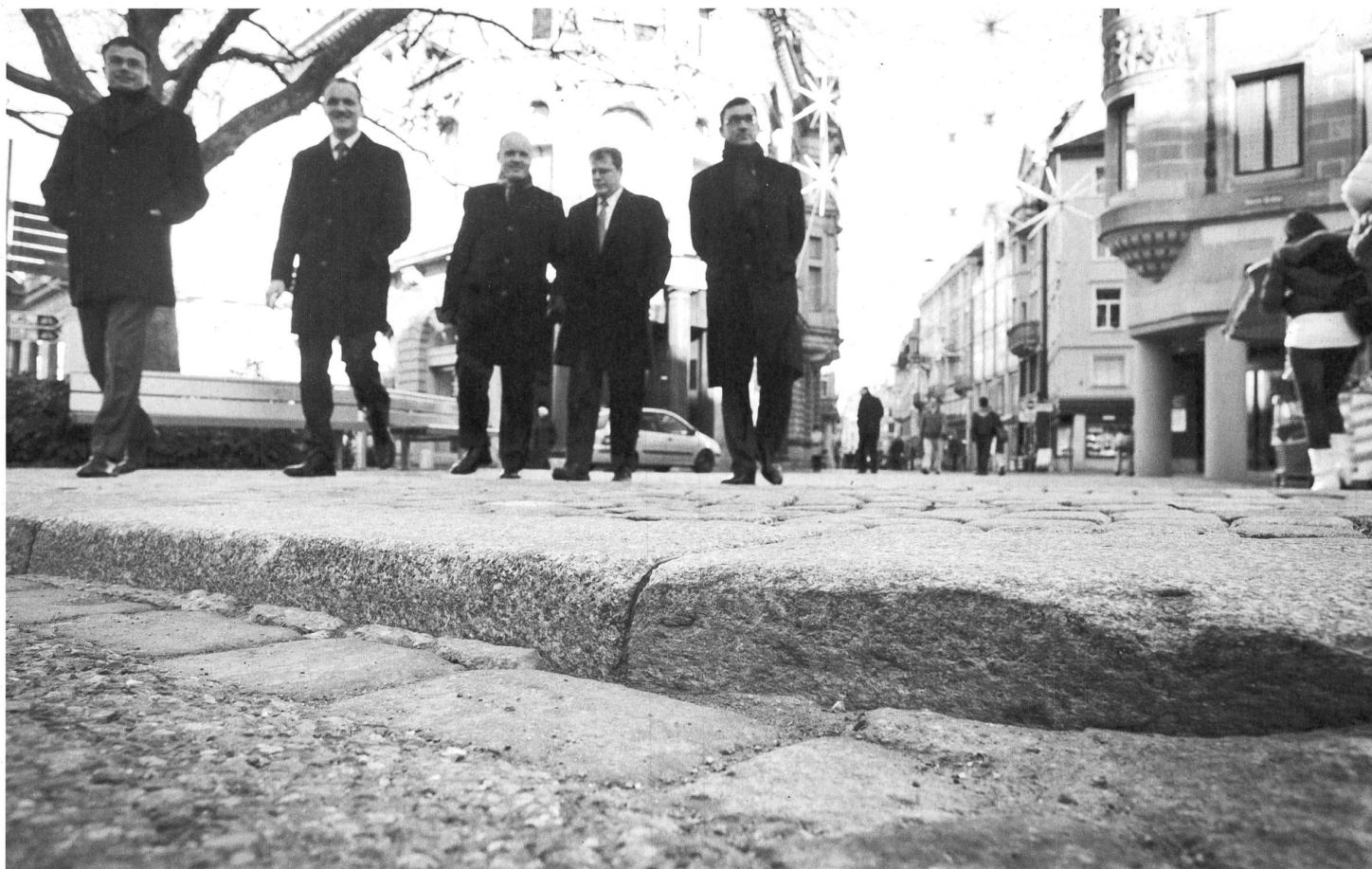
Schön, aber hinderlich: Pflastersteine und Schwellen.

Bei der Stadtpolizei ist zu erfahren, dass bei Behindertenparkplätzen verschiedene Reglemente gelten; je nachdem, ob es sich um öffentliche, halböffentliche oder eben private Parkplätze wie bei der AFG-Arena handelt. Im letzteren Fall gelte das Reglement der Betreiber. Bei öffentlichen Abstellplätzen hingegen werde Falschparken streng gebüsst.