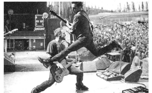
Im Albani sagte Stone Gossard von Pearl Jam noch: «The Stage was like about as big as a drum riser.»

Damit vom Ausblick zum Rückblick: Der Auftritt von Pearl Jam im Albani jährt sich zum zwanzigsten Mal. Am 19. Februar 1992 hatte sich die halbe Stadt in den kleinen, zweistöckigen Club gezwängt. Aufgrund der engen Platzverhältnisse spielte Pearl Jam zum ersten Mal ein semiakustisches Set – ein Experiment, das einen Monat später für MTV in New York wiederholt wurde. Ausschnitte von diesem Konzert sind im Dokumentarfilm «Pearl Jam Twenty» zu sehen. Auch die Nachgeborenen – der Verfasser selber war zu diesem Zeitpunkt gerade zehn Jahre alt