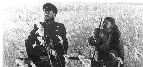
Manche Leute brauchen Bücher, wie Dersu Uzala die Taiga zum Überleben.

Verena Schoch , 1957, ist Kamerafrau und Fotografin und wohnt in Waldstatt.