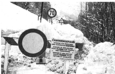
Keine Umgebung für Sandalen: Lech am Arlberg.

In den Bergtälern waren aber tatsächlich Leute eine Zeitlang eingeschlossen, weil die Zufahrtsstrassen wegen Lawinengefahr gesperrt waren. In Lech und Zürs ist das nicht so ein Problem, dort gibt es genug Gäste, die per Hubschrauber entfliehen könnten, falls sie wollten. Wie es einem sonst ergehen kann, habe ich vor