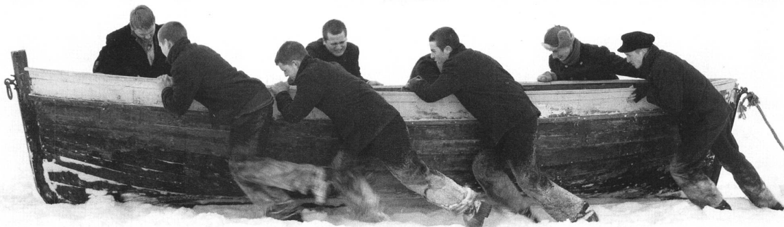
Vergeblicher Fluchtversuch übers gefrorene Meer: Zöglinge beim Ausbüxen.

Bastøy ist die Teufelsinsel (das «Devil's Island» des englischen Verleihtitels) mit der staatlichen Anstalt für Jugendliche. Der Besserungsanstalt würde man besser «Straflager» sagen. An ein solches gemahnt Bastøy viel eher. Anstaltsdirektor Håkon (Stellan Skarsgård) waltet mit eiserner Hand, und an der Wand hängt das Christuskreuz: Es geschieht alles im Namen der Gottesfurcht, zum angeblichen Wohle der jungen Menschen. Unmenschlich dagegen die harten Arbeitseinsätze draussen im Wald, vor allem im Winter. In den Schlafsälen ist es bitterkalt, man sieht den Atemhauch. Als Kollektivstrafe sieht das Reglement halbierte Essensrationen vor. Und aber auch das: Ungestraft kann Aufseher Bråthen (Kristoffer Joner) als Kinderschänder seine Macht missbrauchen.